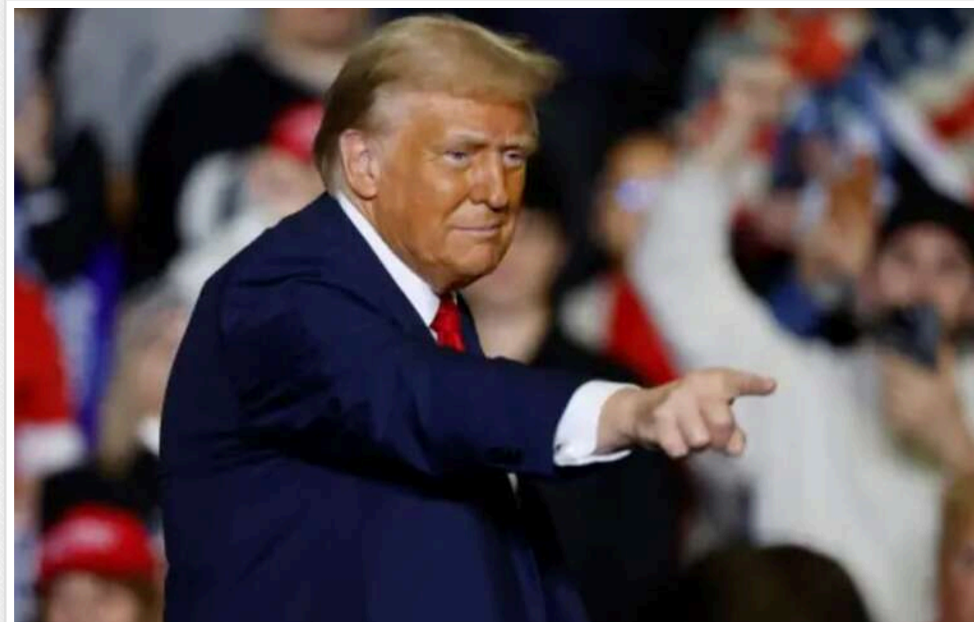
Колишня візажистка Білого дому пояснила, чому шкіра Трампа несподівано набула помаранчевого відтінку

Кімберлі Боссо була візажисткою першої леді Ненсі Рейган і багатьох голлівудських зірок. Вона припустила, чому колір шкіри Дональда Трампа раптово став морквяним. Дональд Трамп, новообраний президент США, відомий не лише своїми заявами, а й виразною зовнішністю: зачіскою та яскраво-помаранчевим кольором шкіри. Це неодноразово робило його героєм мемів, а в соціальних мережах запитували, у чому причина такої трансформації. Відома візажистка Кімберлі Боссо намагалася дати відповідь на це питання. Про це пише Daily Mail.