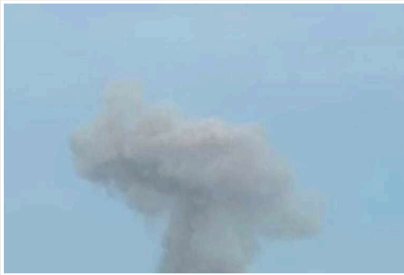
Зранку ворог обстріляв Комишани на Херсонщині: травмовано чоловіка

Внаслідок обстрілів росіян вранці в селищі Комишани на Херсонщині був поранений місцевий мешканець, який перебував у будинку під час удару.