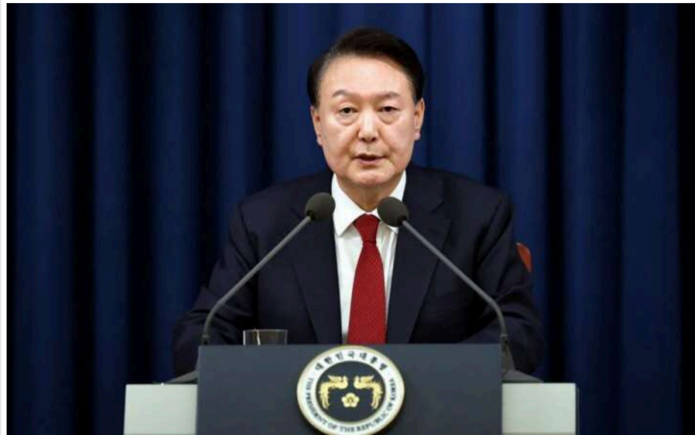
У Південній Кореї президент вибачився за запровадження воєнного стану

Президент Південної Кореї Юн Сок Йоль попросив вибачення за спробу запровадити воєнний стан у країні цього тижня. Проте, попри сильний тиск, навіть з боку деяких членів його партії, він не подав у відставку.