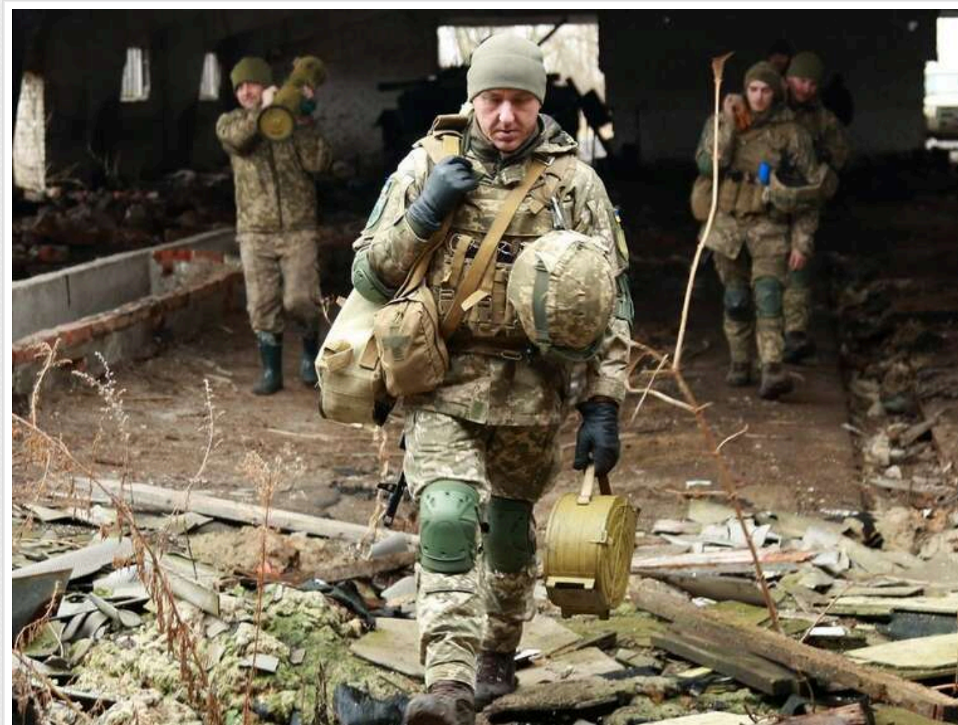
Ситуація на фронті: у Курській області точаться запеклі бої

Від початку доби 6 грудня на фронті зафіксовано 163 бойові зіткнення. Найбільше боїв відбувається на Покровському та Курахівському напрямках, а в Курській області, де триває операція ЗСУ, йдуть запеклі бої.