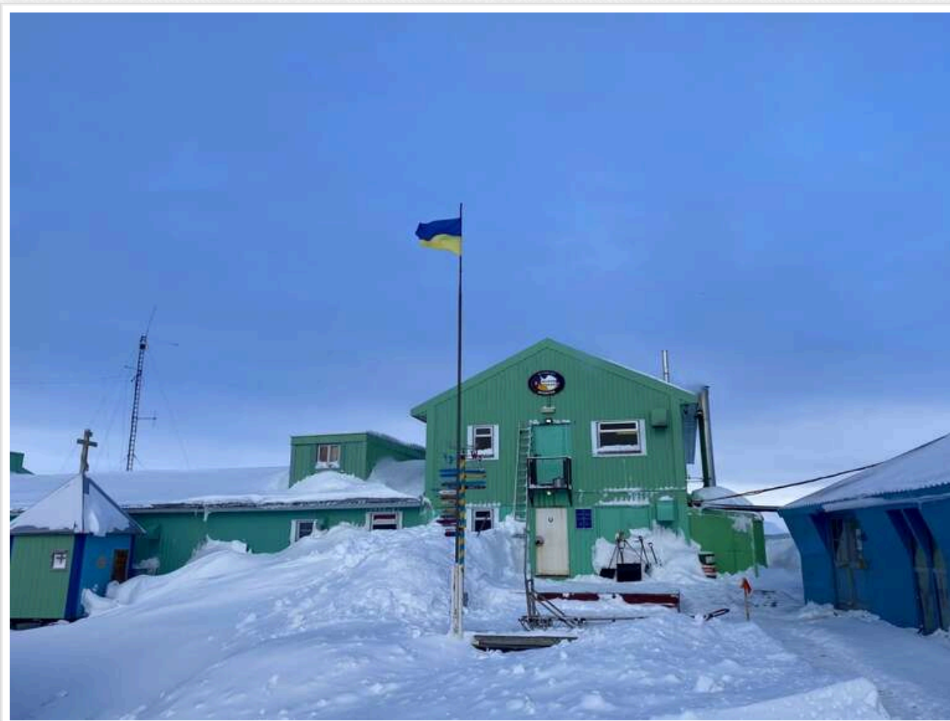
ЗМІ: Національний арктичний науковий центр «злив» 45 мільйонів доларів підряднику, пов'язаному з «гаманцем» Лукашенка

ДБР почало розслідування контрактів на 45 млн доларів ДУ «Національний Антарктичний науковий центр» МОН, який очолює Євген Дикий.