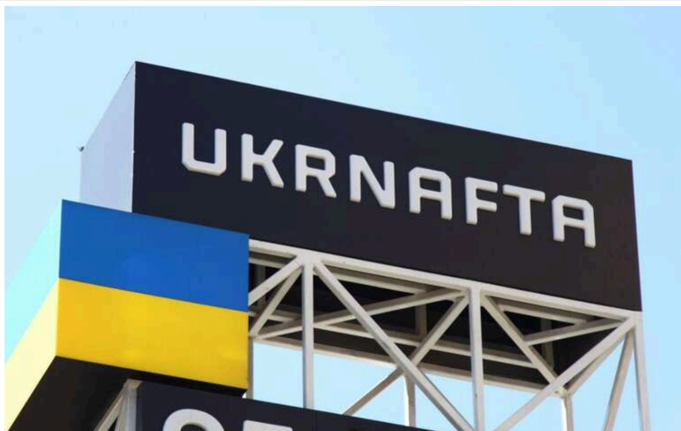
Скандал навколо тендеру «Укрнафти»: переможець пов'язаний із чиновником митної служби Ковтуном: є ознаки змови та відмивання коштів