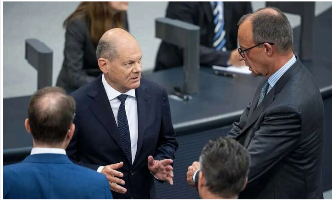
Spiegel: Боротьба за посаду нового канцлера Німеччини розгортається довкола теми України

Як повідомляє видання, замість того, щоб чітко пояснити свою позицію, Шольц і Мерц "застрягли в колі взаємних звинувачень".