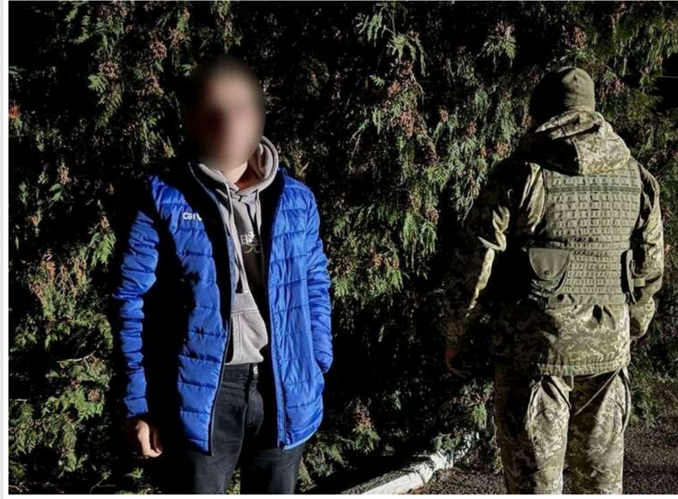
Військового, який здійснив СЗЧ і втік до Румунії, затримали на кордоні

На кордоні затримали військовослужбовця, який на початку жовтня залишив службу та втік до Румунії. Але, дізнавшись про мобілізацію брата, він вирішив повернутися до лав Сил оборони України.