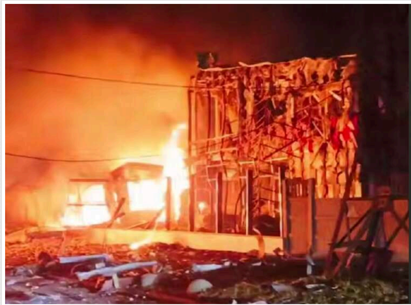
Окупанти завдали ударів по Запоріжжю: палає СТО

В ОВА повідомили, що росіяни завдали ударів по Запорізькій області, палає СТО.