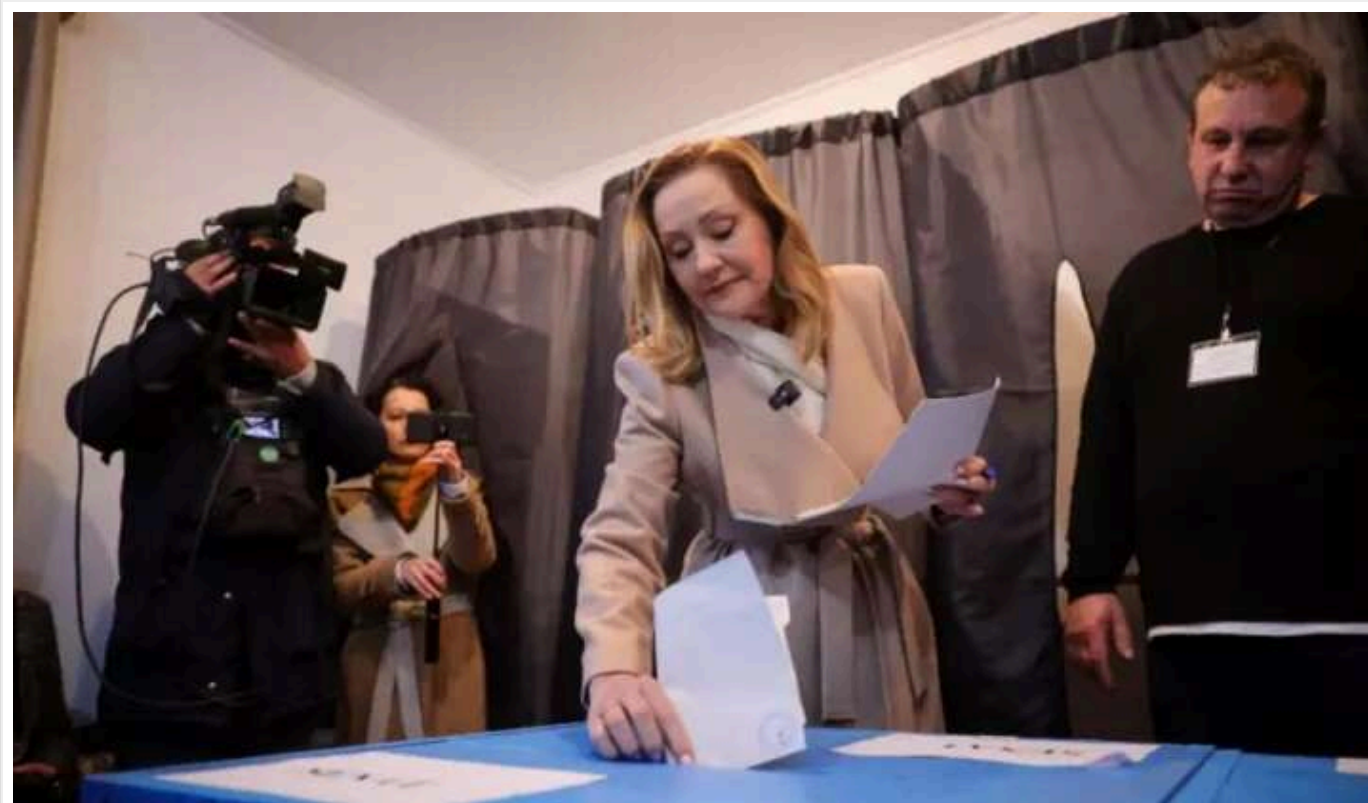
«Проєвропейська» кандидатка Олена Ласконі назвала незаконним рішення КС скасувати підсумки I туру виборів президента Румунії

Кандидатка на пост президента Румунії, яка підтримує європейську інтеграцію, Елена Ласконі назвала незаконним скасування результатів першого туру президентських виборів, повідомляє Digi24.