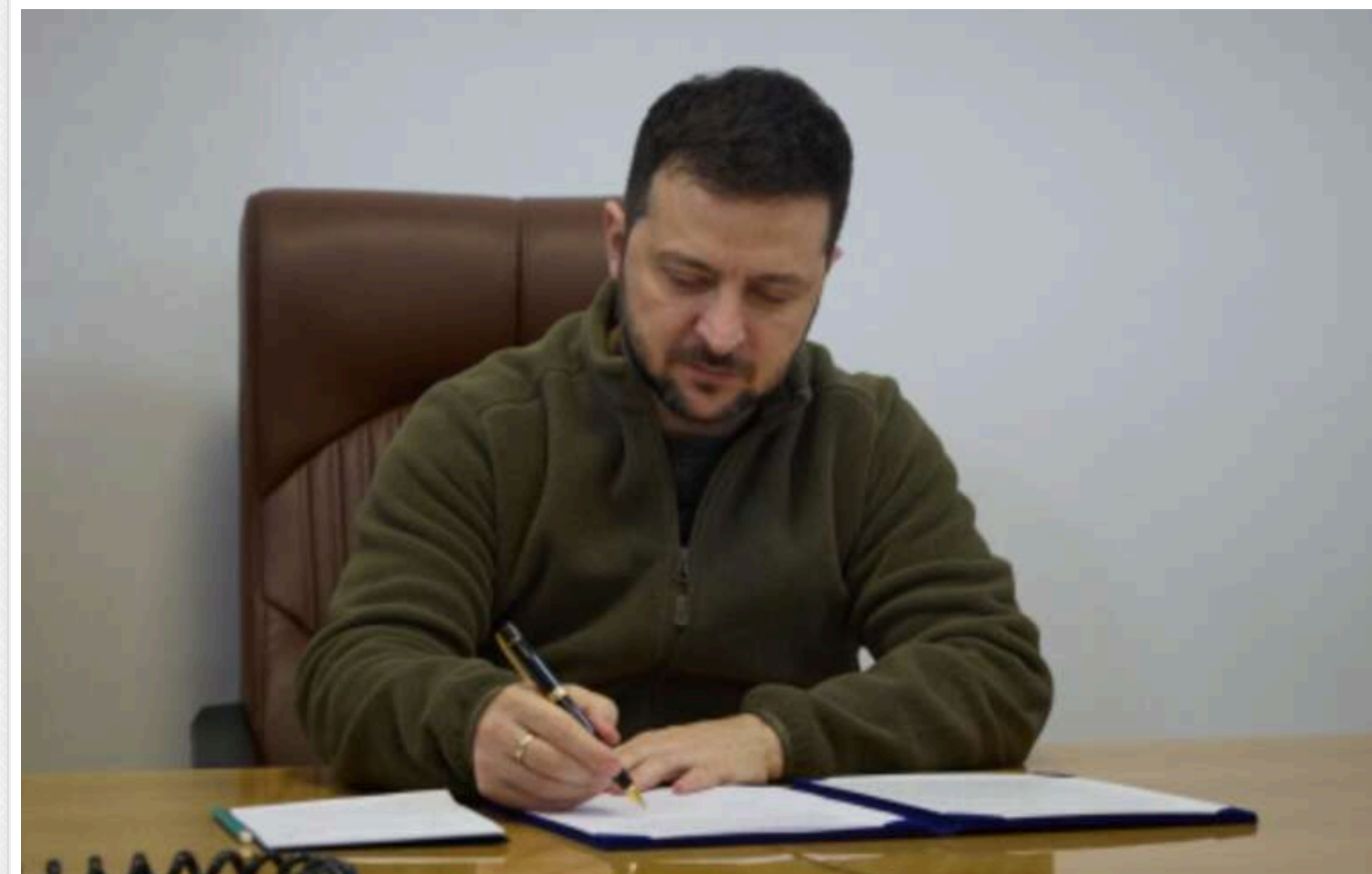
Зеленський реалізував рішення РНБО щодо перегляду умов бронювання медиків та цифровізації ВЛК

Президент Володимир Зеленський ввів у дію рішення Ради національної безпеки та оборони України щодо протидії загрозам національній безпеці у сфері охорони здоров'я в особливий період.