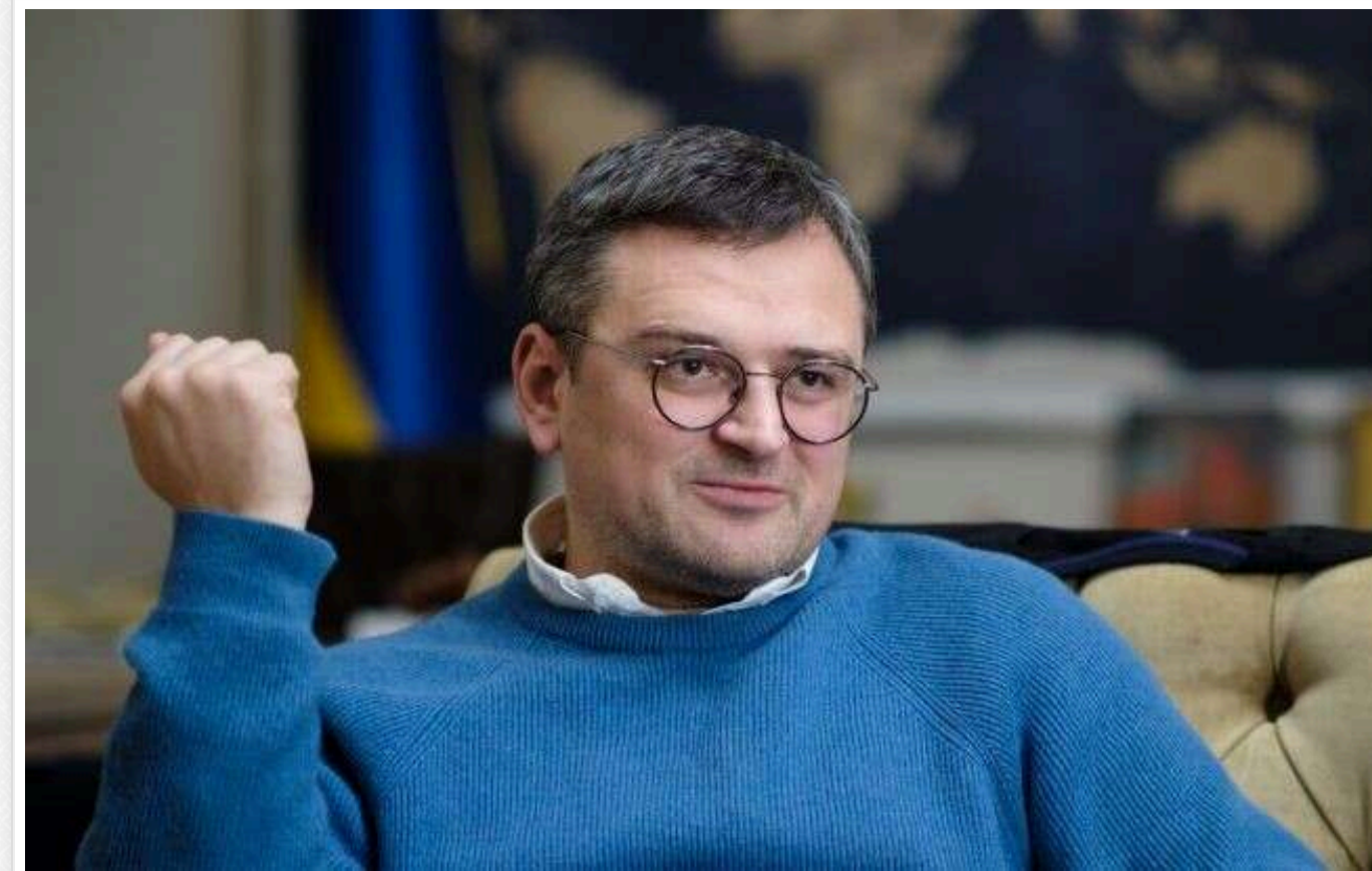
Колишній міністр закордонних справ України Кулеба працює в США