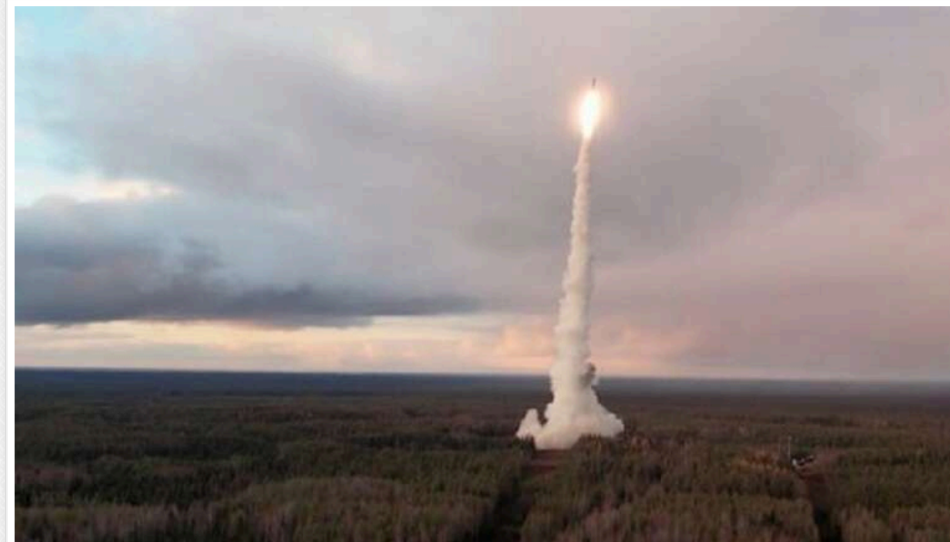
По місцю запуску ракети "Орешник" вдарив український безпілотнок, - росЗМІ

Згідно з повідомленнями, український безпілотнок вибухнув за кілька метрів від полігону, пошкодивши його огорожу.