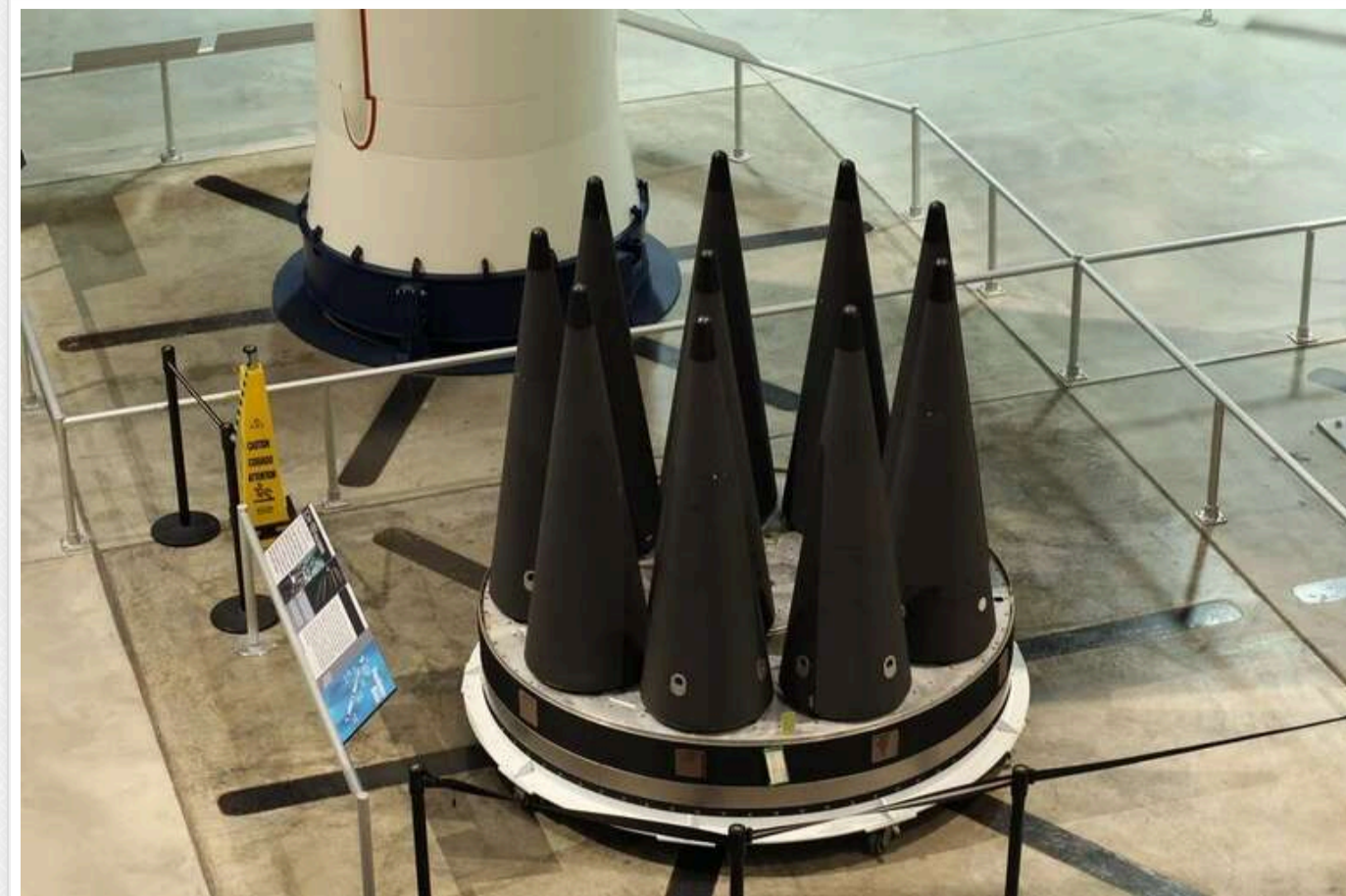
У Defense Express пояснили, чи може РФ скидати з космосу кінетичні боєголовки для ударів по Україні

За словами аналітиків, якщо в РФ зроблять моноблокову кінетичну бойову частину вагою 1 500 кг, для її запуску знадобиться балістична ракета середньої дальності з прогнозованою стартовою масою 30-40 тонн.