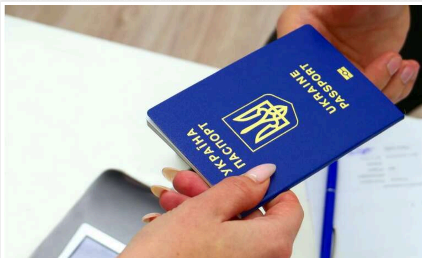
ЗМІ: Паспортні сервіси за кордоном відмовляють 18-річним українцям, які не стоять на військовому обліку, у видачі паспортів

Паспортні служби за кордоном масово відмовляють у видачі паспортів (включаючи закордонні) 18-річним українцям, які не перебувають на військовому обліку.