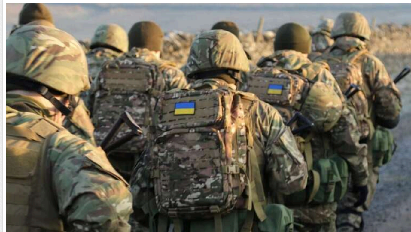
Ситуація на фронті: За добу 168 боїв, половина відбулась на двох напрямках

Протягом минулої доби, 4 грудня, на фронті відбулося 168 бойових зіткнень. Половину з них зафіксовано на Покровському та Курахівському напрямках.