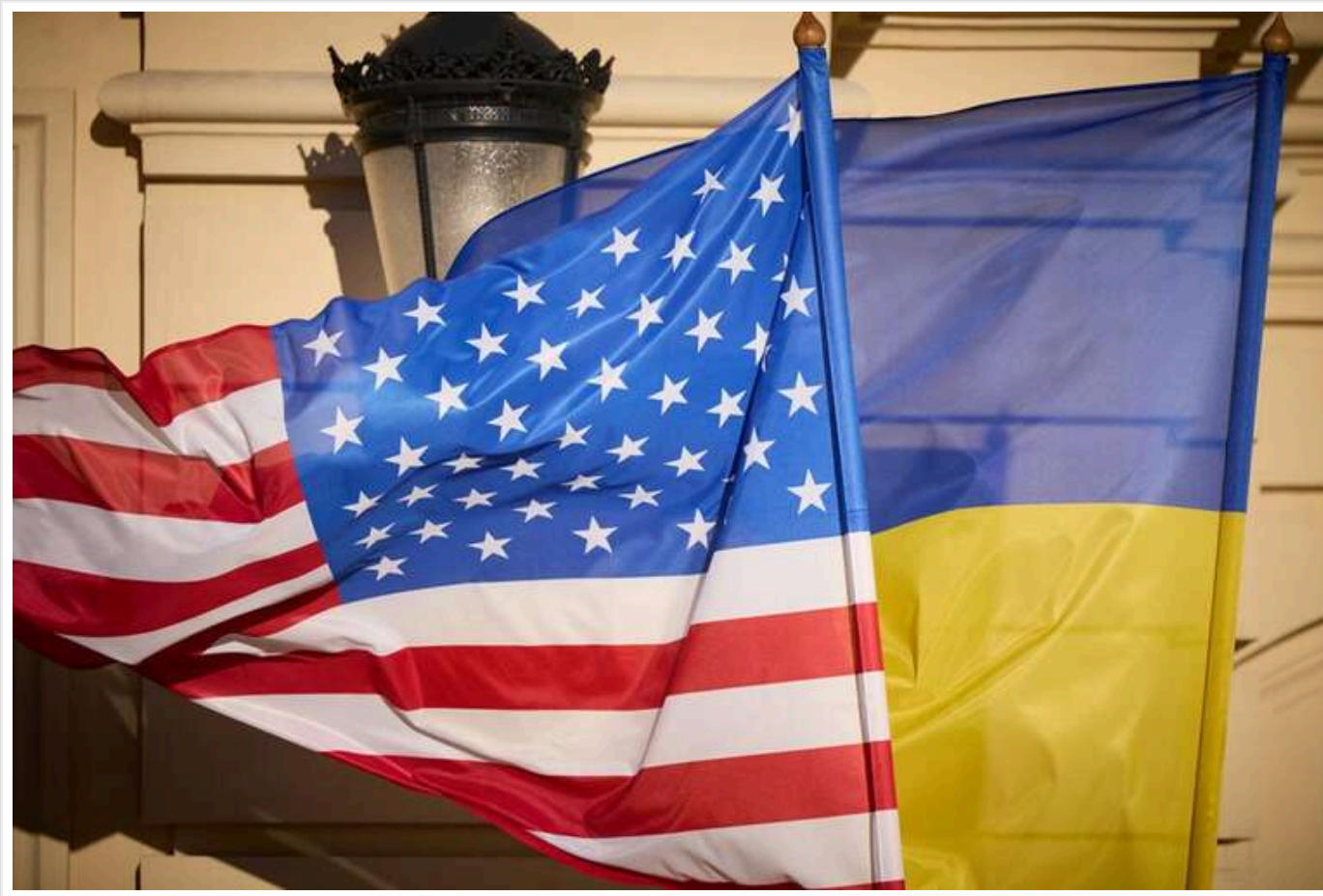
В WSJ розкрили деталі переговорів України з командою Трампа про припинення війни

Українські посадовці проводять зустрічі на високому рівні з новою адміністрацією новообраного президента США Дональда Трампа, щоб зменшити розбіжності щодо мирного врегулювання війни РФ проти України ще до його вступу на посаду, повідомляє WSJ.