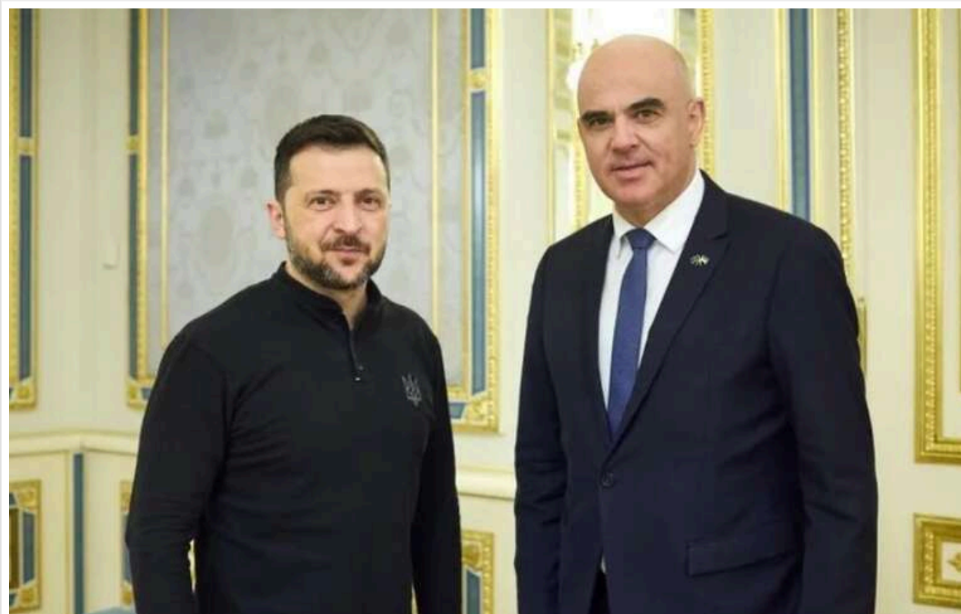
Зеленський обговорив з генсекретарем Євроради звільнення полонених і повернення незаконно депортованих українських дітей

Президент Володимир Зеленський 4 грудня зустрівся з генеральним секретарем Ради Європи Аленом Берсе. Вони говорили про створення спеціального трибуналу з приводу злочину агресії та окремо – про звільнення полонених і повернення незаконно депортованих Росією українських дітей.