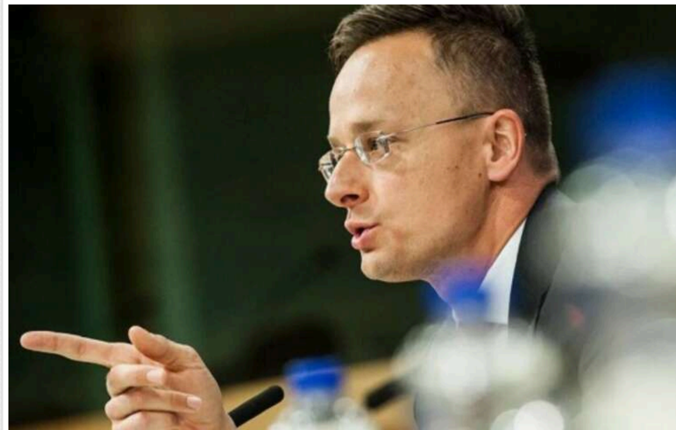
Угорщина вимагає від Штатів звільнити "Газпромбанк" від санкцій: не можуть заплатити за газ

Угорщина звернулася до США з проханням звільнити російській "Газпромбанк" від санкцій на платежі за природний газ, оскільки ці санкції можуть негативно позначитися на деяких союзниках США.