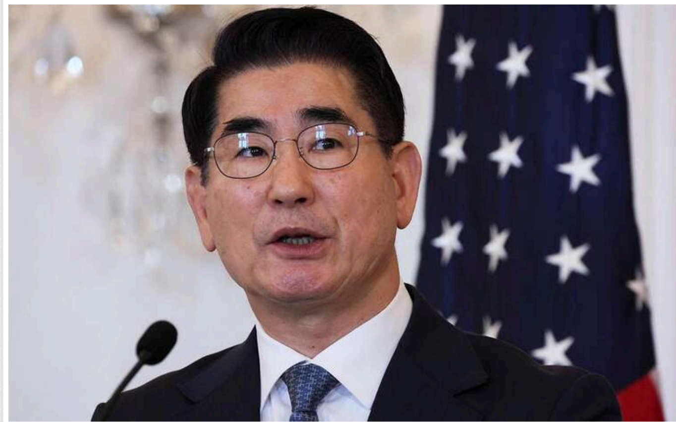
Міністр оборони Південної Кореї вирішив піти у відставку

Міністр оборони Південної Кореї Кім Йон Хьон вирішив піти у відставку, вибачившись перед жителями країни за недавні події, що викликали критику суспільства, повідомляє агентство "Рьонхан".