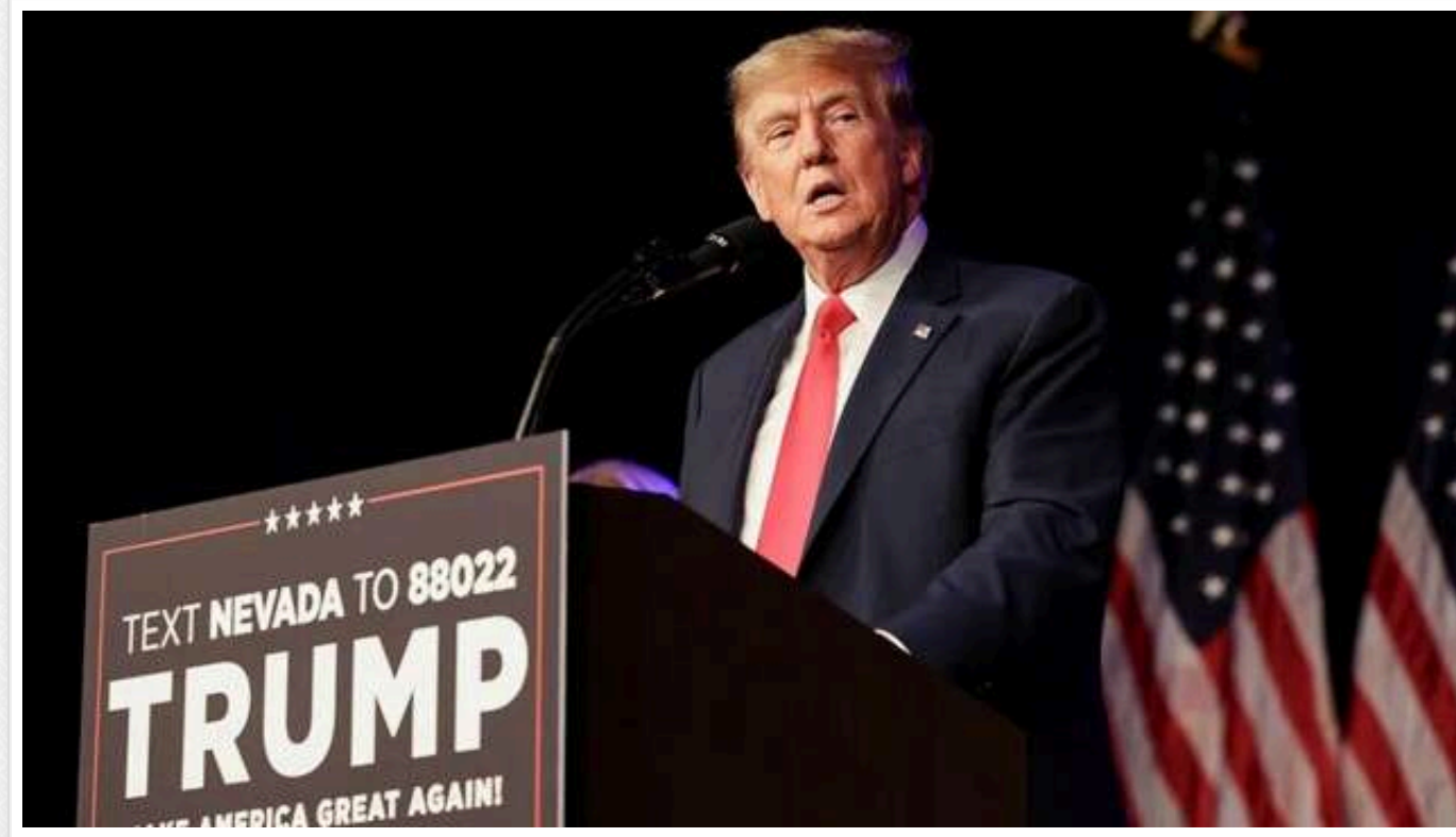
Основні пункти потенційного плану Трампа щодо України: територіальні поступки, відкладене членство в НАТО, більше зброї, якщо РФ не погодиться

У Reuters повідомляють, що Україні запропонують піти на територіальні поступки Росії відповідно до плану врегулювання конфлікту, який може запропонувати новообраний президент США Дональд Трамп.