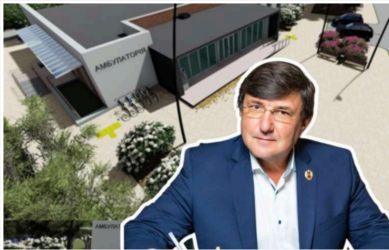
На Одещині побудують амбулаторію за 52 мільйони - з цінами, вищими за ринкові

Чорноморська селищна рада Одеського району Одеської області 25 листопада за результатами тендеру замовила ТОВ «Екстер'єр-Дизайн» будівництво амбулаторії загальної практики – сімейної медицини за 52,59 млн грн.