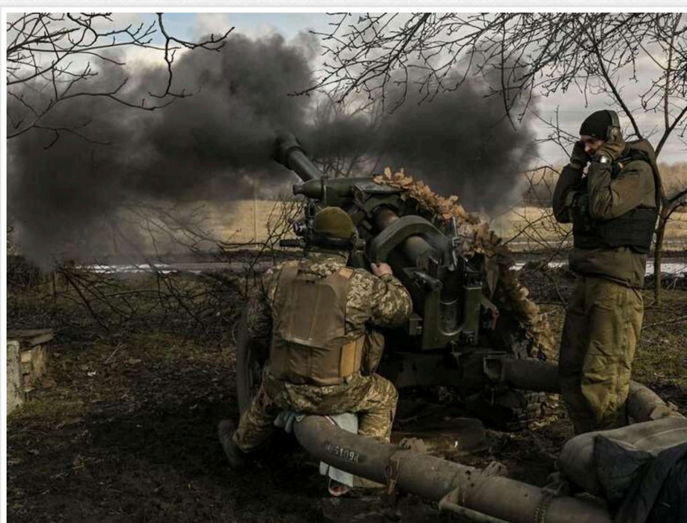
ISW: ЗСУ просунулися на Курщині та повернули втрачені позиції в районі Куп'янська

Українські військовослужбовці продовжують операцію на території Курської області. Нещодавно бійці ЗСУ просунулися на головному виступі на Курщині в районі Дар'ного (на південний схід від Кореневого).