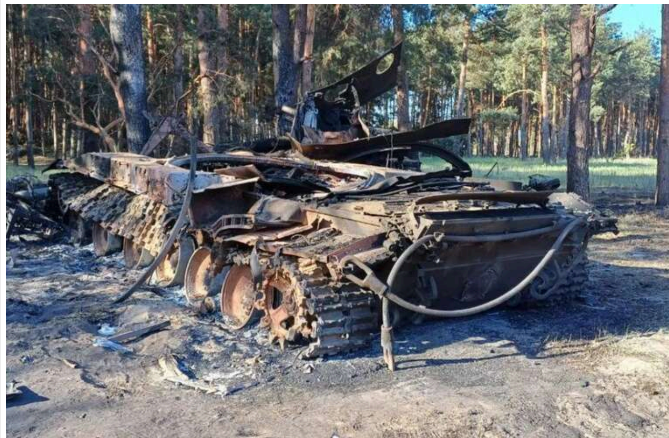
Втрати ворога за добу: ЗСУ відмінували 1670 окупантів, 31 ББМ та 26 артсистем

Сили оборони продовжують "денацифікацію" та "демільтаризацію" російської армії в Україні. Напередодні, 3 грудня, втрати окупантів у живій силі становили 1670 осіб.