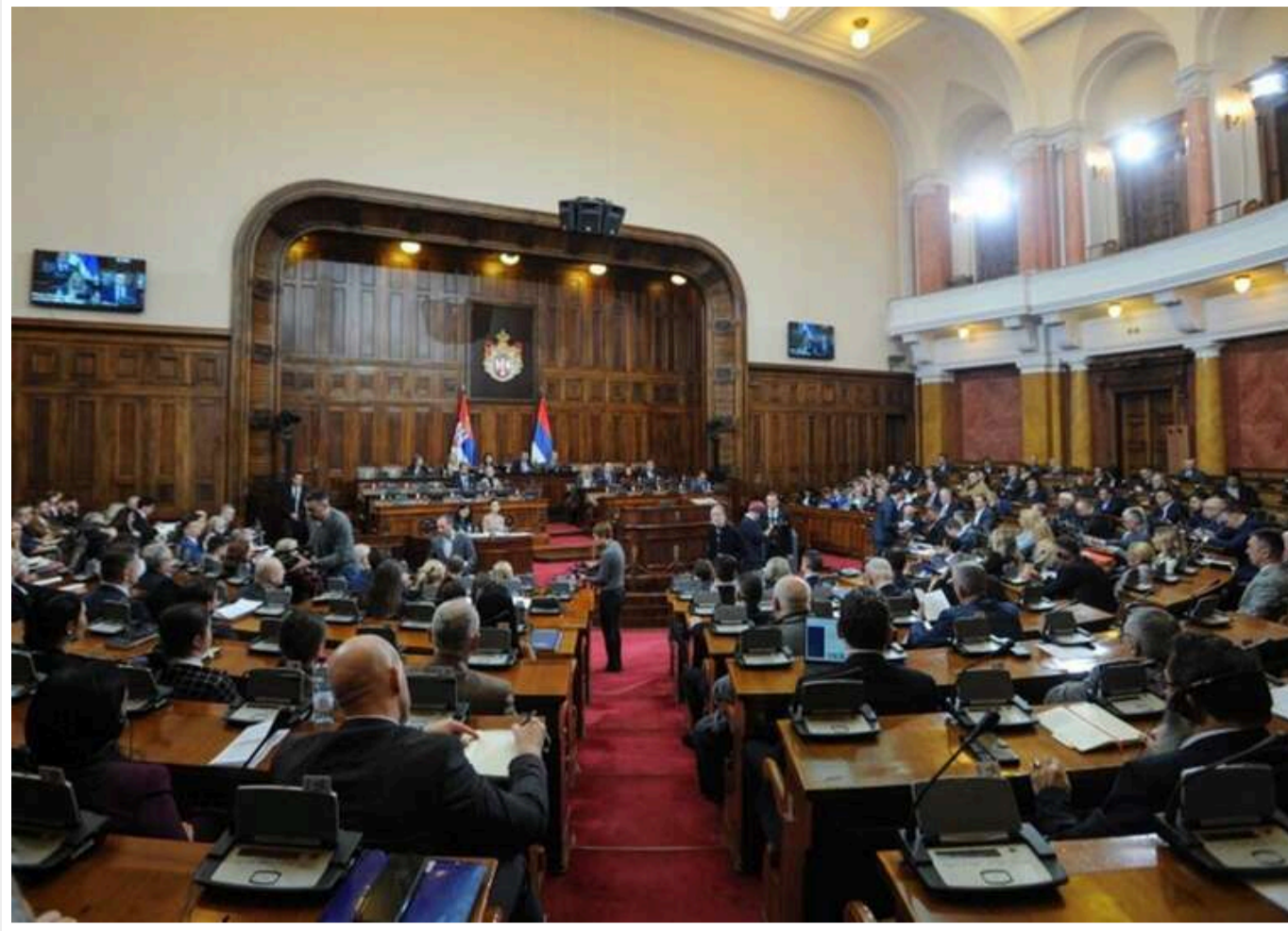
ЄС застеріг Сербію через законопроект про «іноагентів»

Парламент Сербії отримав від місцевих соціалістів законопроект про "іноземних агентів", що нагадує російський. Проект передбачає, що організації та фізичні особи, які отримують фінансування з-за кордону, повинні зареєструватися і вказувати статус "іноагента" в своїх публікаціях. Порушників планують штрафувати або притягувати до кримінальної відповідальності.