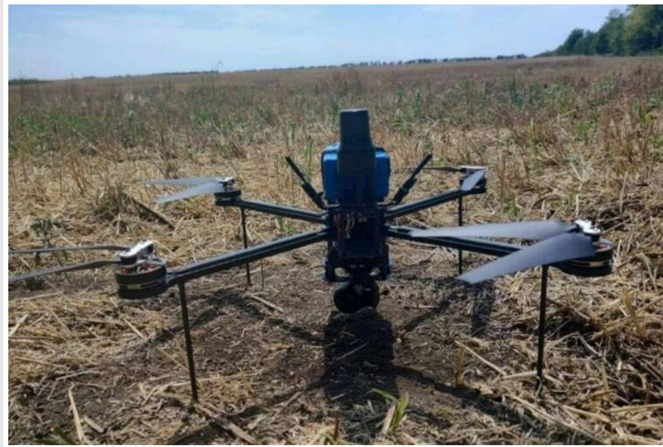
Федоров: Україні вдалося створити вітчизняний Mavic

В Україні створили три аналоги китайського дрону Mavic. Ці дрони відповідають стандартам НАТО, мають захист від РЕБ та функцію автоматичної посадки.