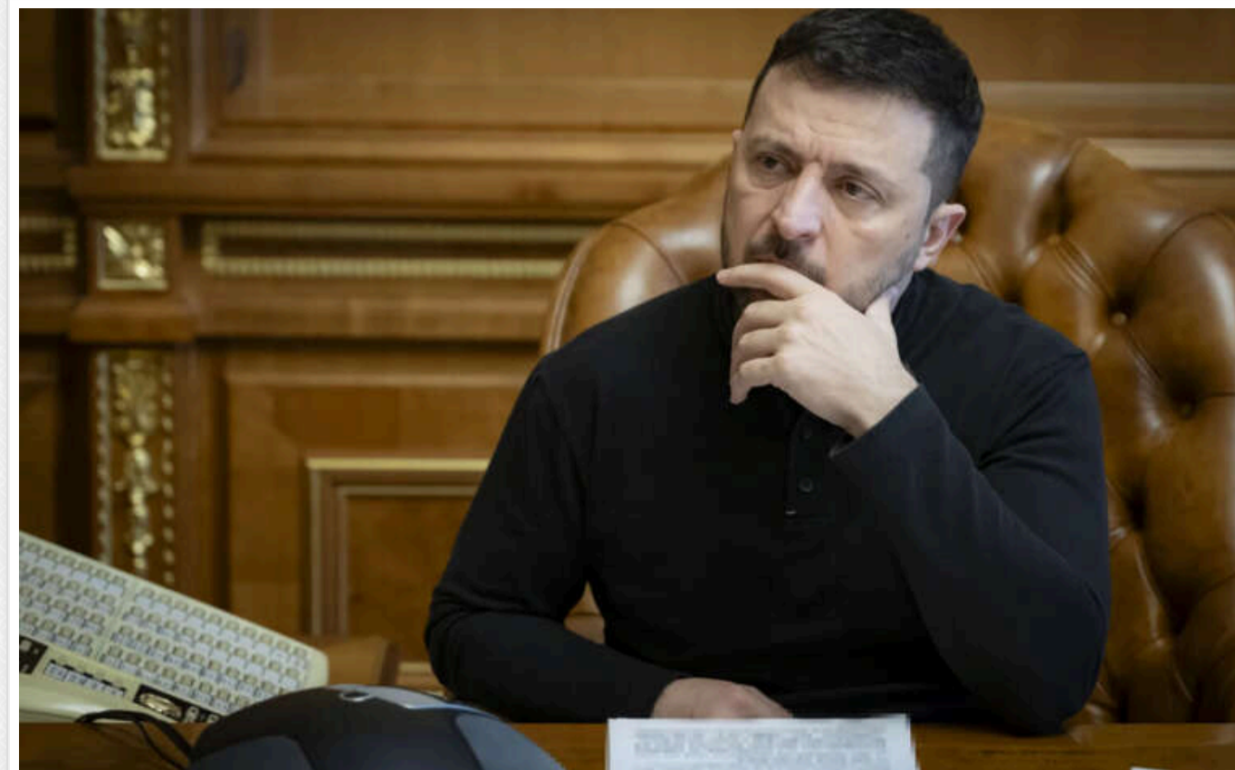
Кремль вимагає від Трампа «усунути Зеленського»: українські журналісти прокоментували статтю Financial Times

Журналіст Юрій Ніколов звернув увагу на одну зі статей в американському виданні Financial Times , яке розмістило поруч на шпальті важливі новини про Україну. Особливо журналіста-розслідувача здивувала вимога Кремля до Дональда Трампа стосовно президента Володимира Зеленського.