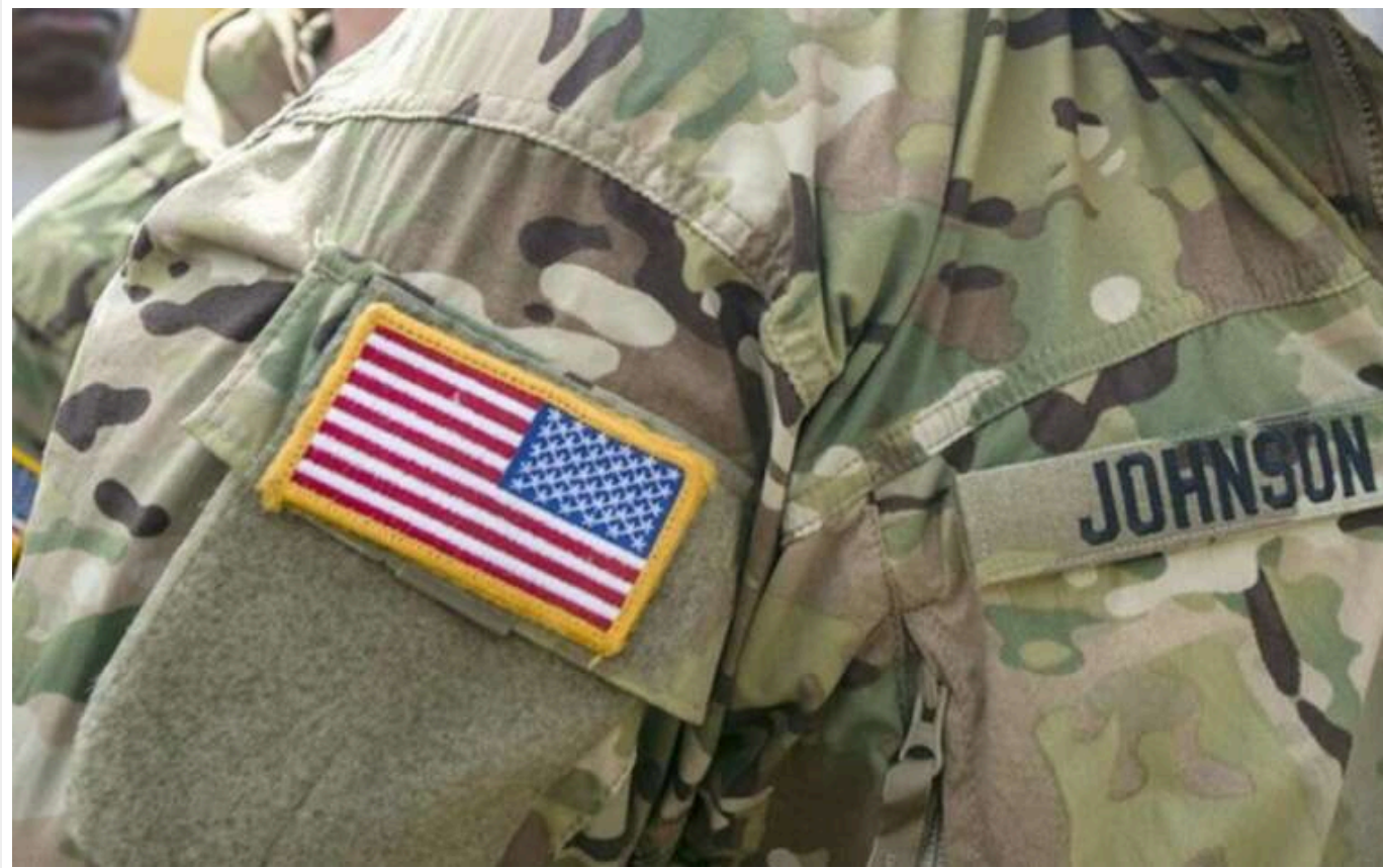
WP: У Білому домі стурбовані, що "спринт" із наданням військової допомоги Україні може послабити збройні сили США

Видання The Washington Post з Америки повідомляє про занепокоєння посадовців Білого дому щодо "гонки" з надання Україні останніх пакетів військової допомоги, оскільки це може вплинути на стан готовності армії Сполучених Штатів.