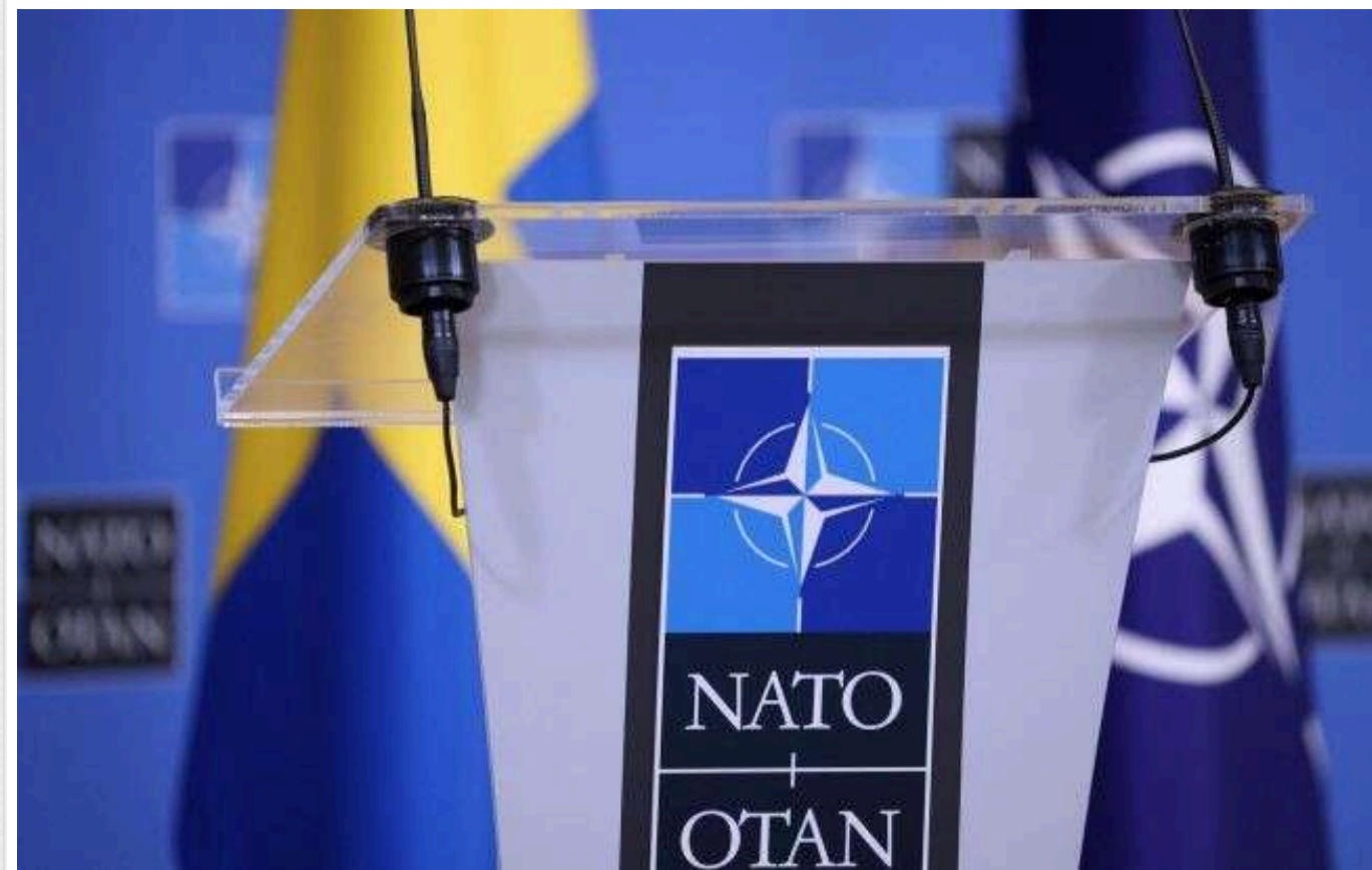
НАТО на сьогоднішній зустрічі не "прислухається до заклику України запросити вступити в Альянс", - Reuters

НАТО "навряд чи відреагує на заклик України щодо запрошення до вступу в Альянс" на сьогоднішній зустрічі міністрів закордонних справ, повідомляє Reuters з посиланням на джерела.