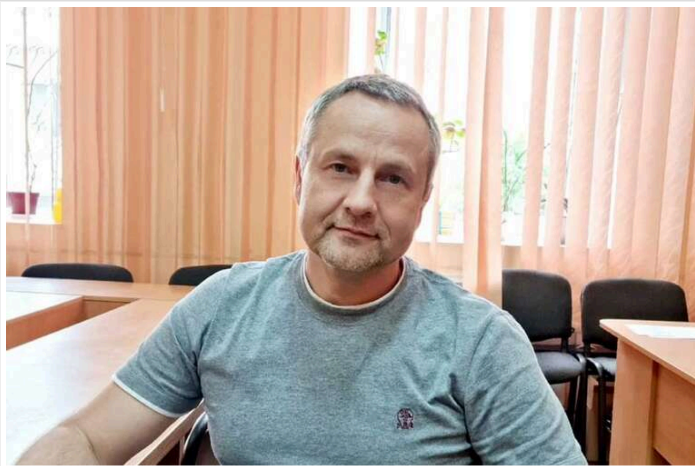
Викраденого мера Херсона Ігоря Колихаєва бачили в таємній в'язниці ФСБ РФ

Херсонського міського голову Ігоря Колихаєва, викраденого окупантами в червні 2022 року, бачили в таємній в'язниці Федеральної служби безпеки (ФСБ) на території Криму. Під час захоплення міста воєнні злочинці затримали чиновника через його відмову співпрацювати з окупаційною адміністрацією РФ.