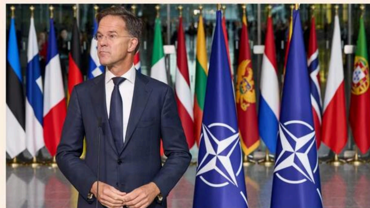
Mark Rutte: 'We cannot have a situation where we have Kim Jong Un and the Russian leader and Xi Jinping and Iran high-fiving because we came to a deal which is not good for Ukraine'

Mark Rutte says risks to America will increase if China, Russia, Iran and North Korea are empowered