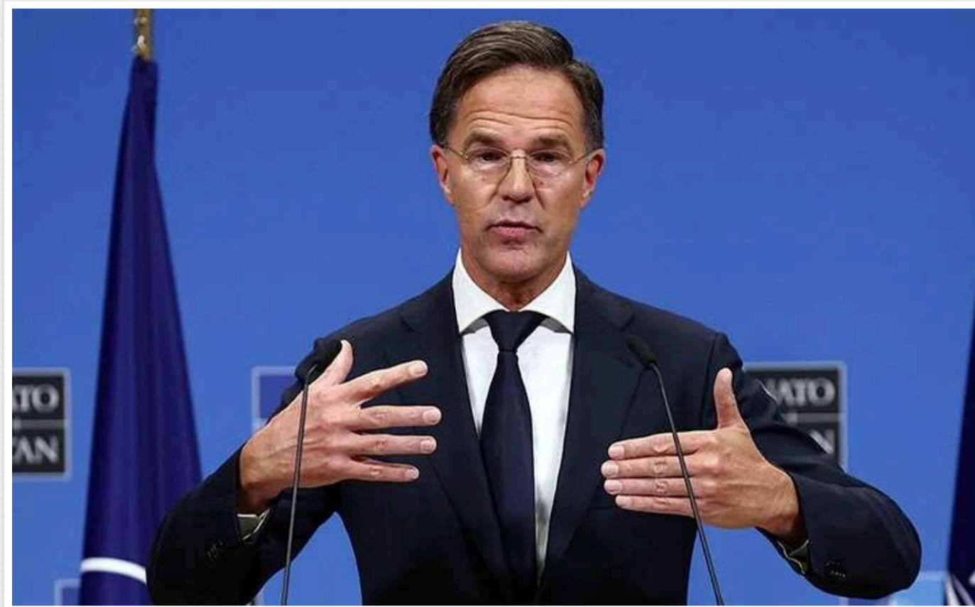
Рютте вважає, що питання членства України в НАТО зараз другорядне, - FT

Генеральний секретар НАТО заявив, що питання членства України в Альянсі на даний момент має другорядне значення, повідомляє Financial Times.