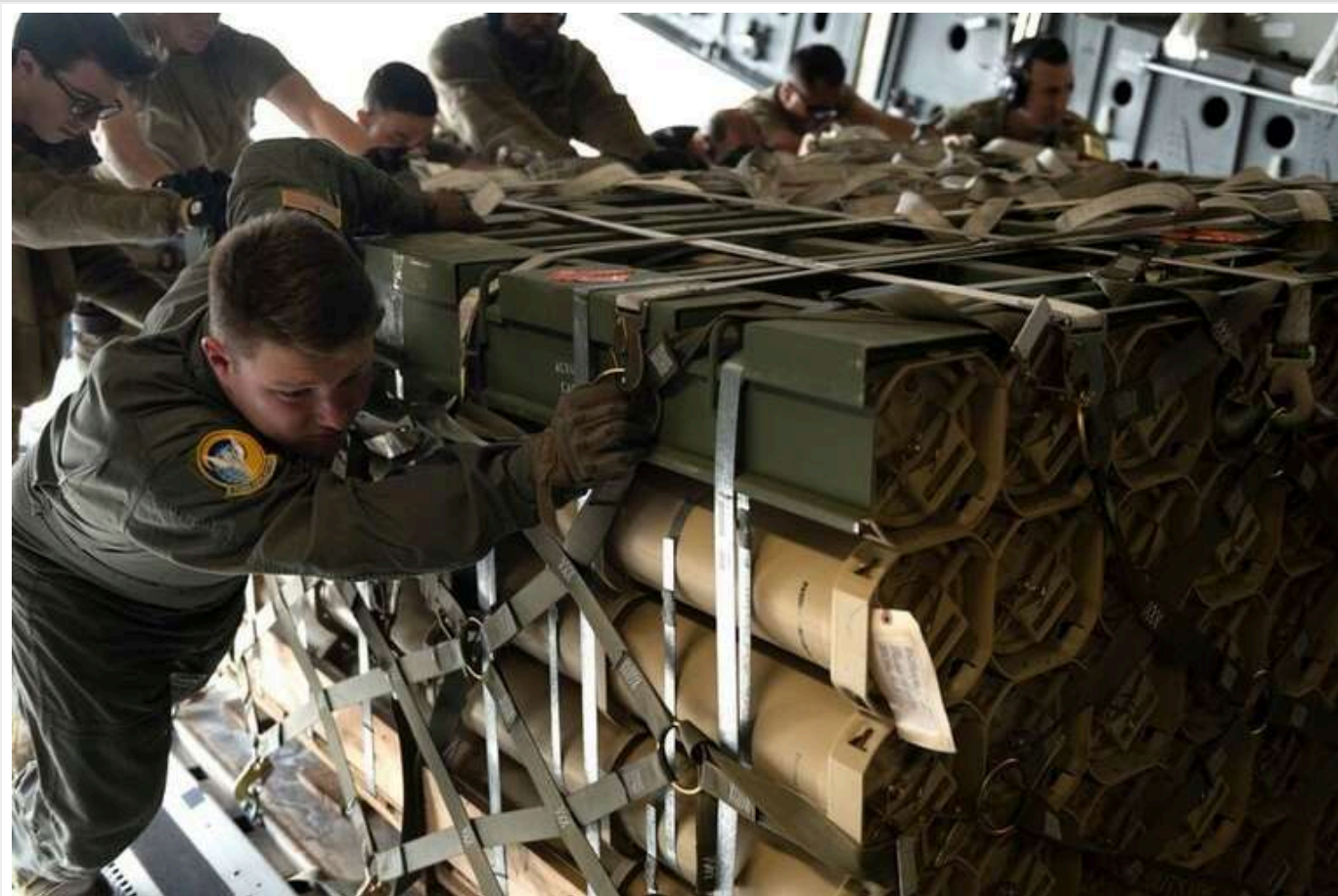
Новий пакет військової допомоги Україні на 725 мільйонів доларів: що входить до складу

У понеділок, 2 грудня, уряд Сполучених Штатів оголосив про надання нового пакету допомоги Україні в галузі безпеки на суму $725 мільйонів, що включає ракети HIMARS, артилерійські снаряди, безпілотні авіаційні системи, комплекси Stinger та інші озброєння.