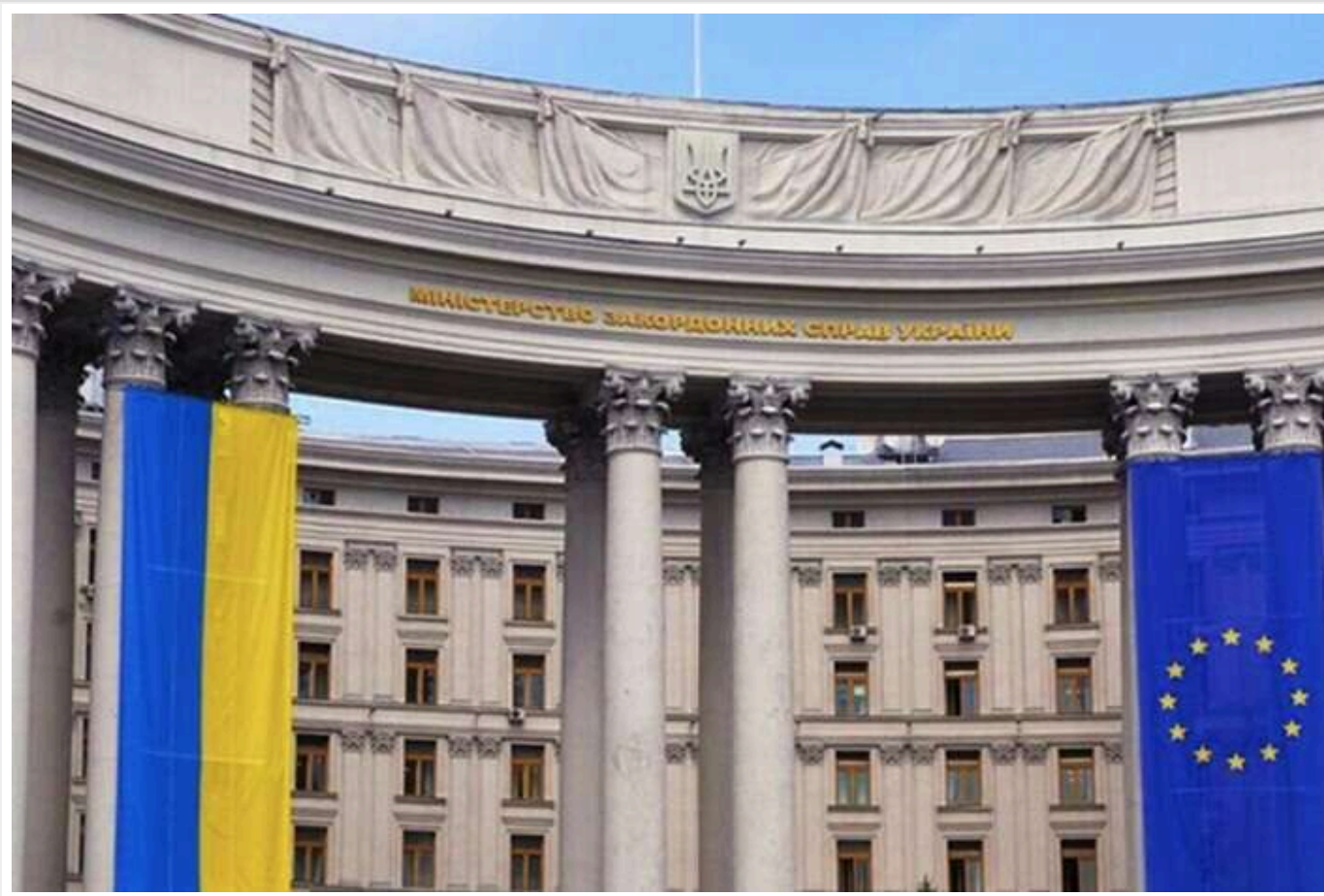
У МЗС заявили, що Україна відмовляється від гарантій, які є заміниками членства в НАТО

Міністерство закордонних справ України в день початку міністерської зустрічі НАТО висловило офіційну позицію щодо можливих гарантій безпеки, які можуть розглядатися як інструмент стримування агресії Росії. У відомстві зазначили, що країна відмовляється від таких гарантій, які заміняють членство в Північноатлантичному альянсі.