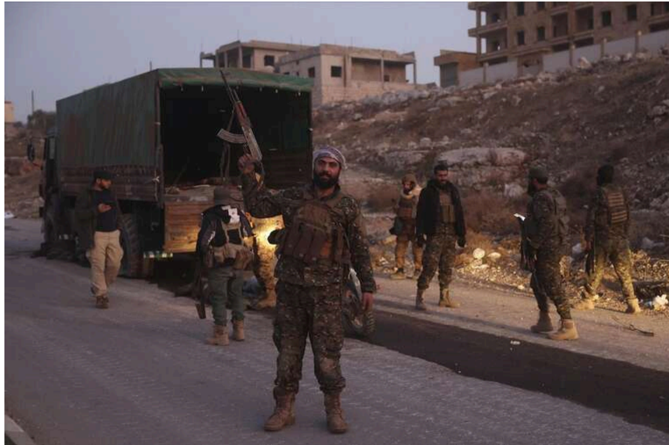
Без Росії та Ірану Сирія не змогла стримати повстанців

Сирія не змогла втримати повстанців без допомоги Росії та Ірану: ті «сподіваються дійти до Дамаска».