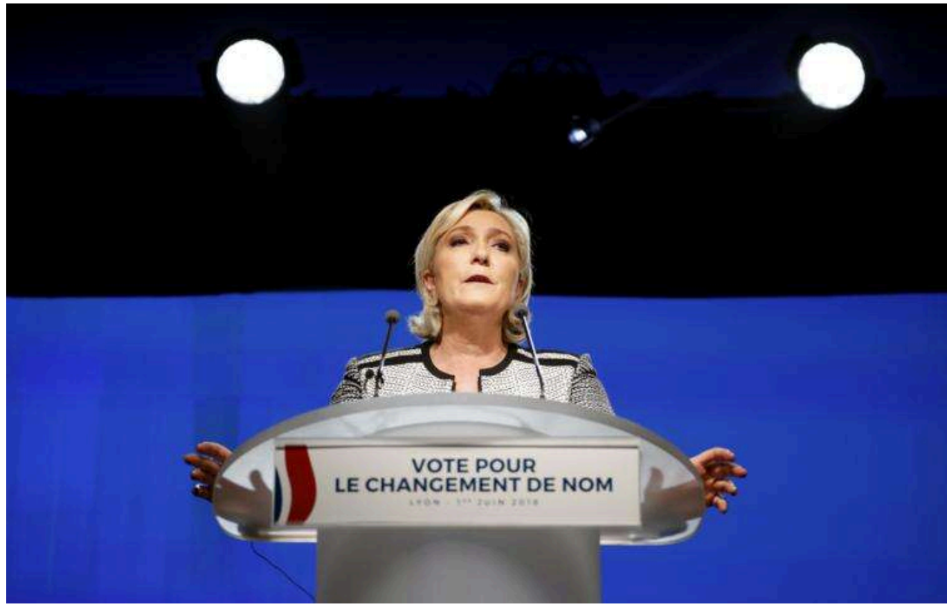
Партія Ле Пен і "Новий фронт" заявили, що підтримають вотум недовіри уряду Франції

Ультраправе "Національне об'єднання" (НО) заявило, що підтримає вотум недовіри уряду Франції. Таку заяву ультраправі зробили після того, як прем'єр-міністр Мішель Барньє скористався спеціальною статтею Конституції для ухвалення бюджету соціального страхування без голосування в парламенті.