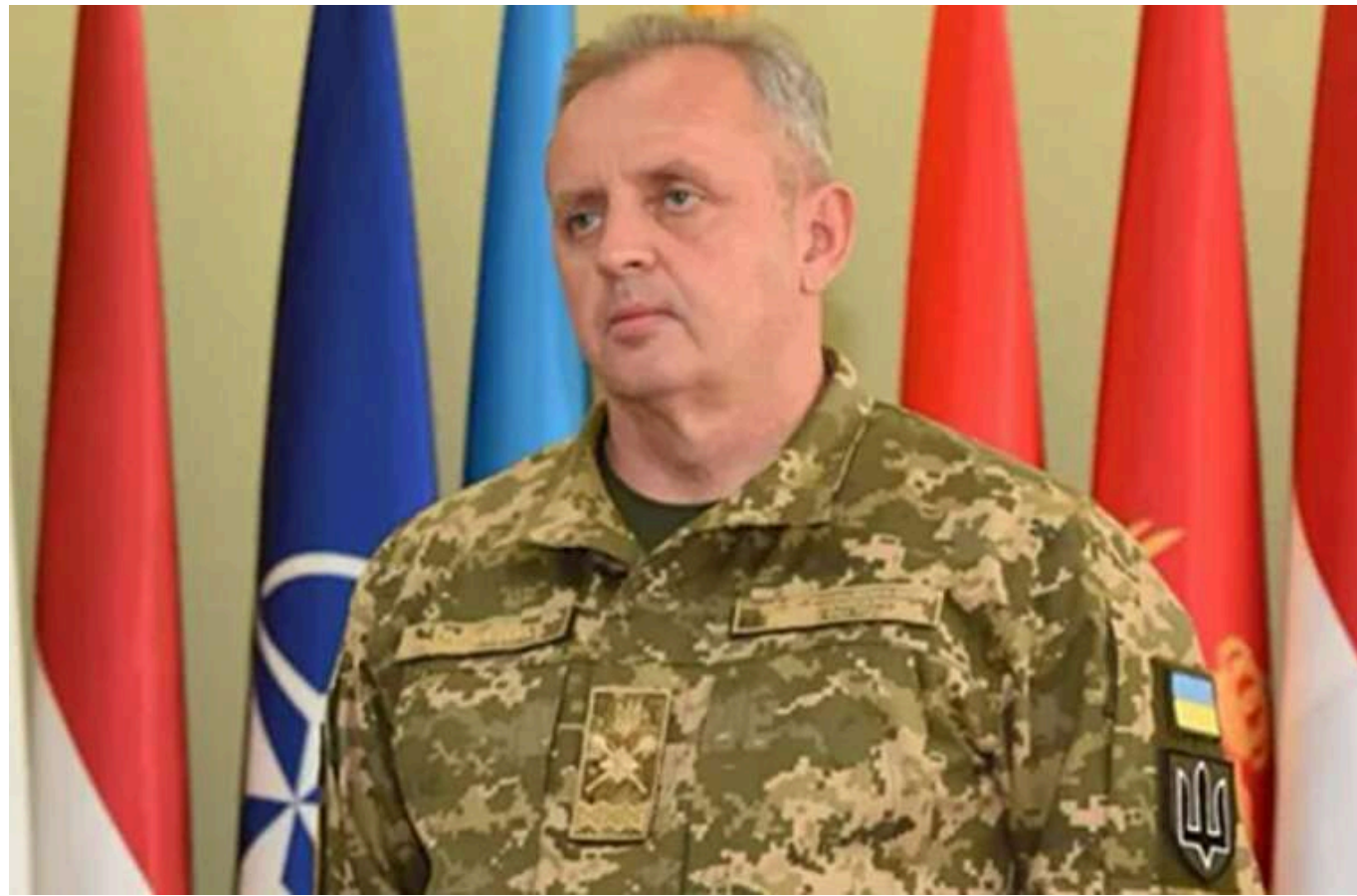
Муженко: Чого очікувати на передовій і чи існує небезпека для Сум і Запоріжжя

Якщо частини Збройних Сил України відійдуть із Курської області, то російські військові, зараз розташовані там, можуть спрямувати наступ у бік Сум.