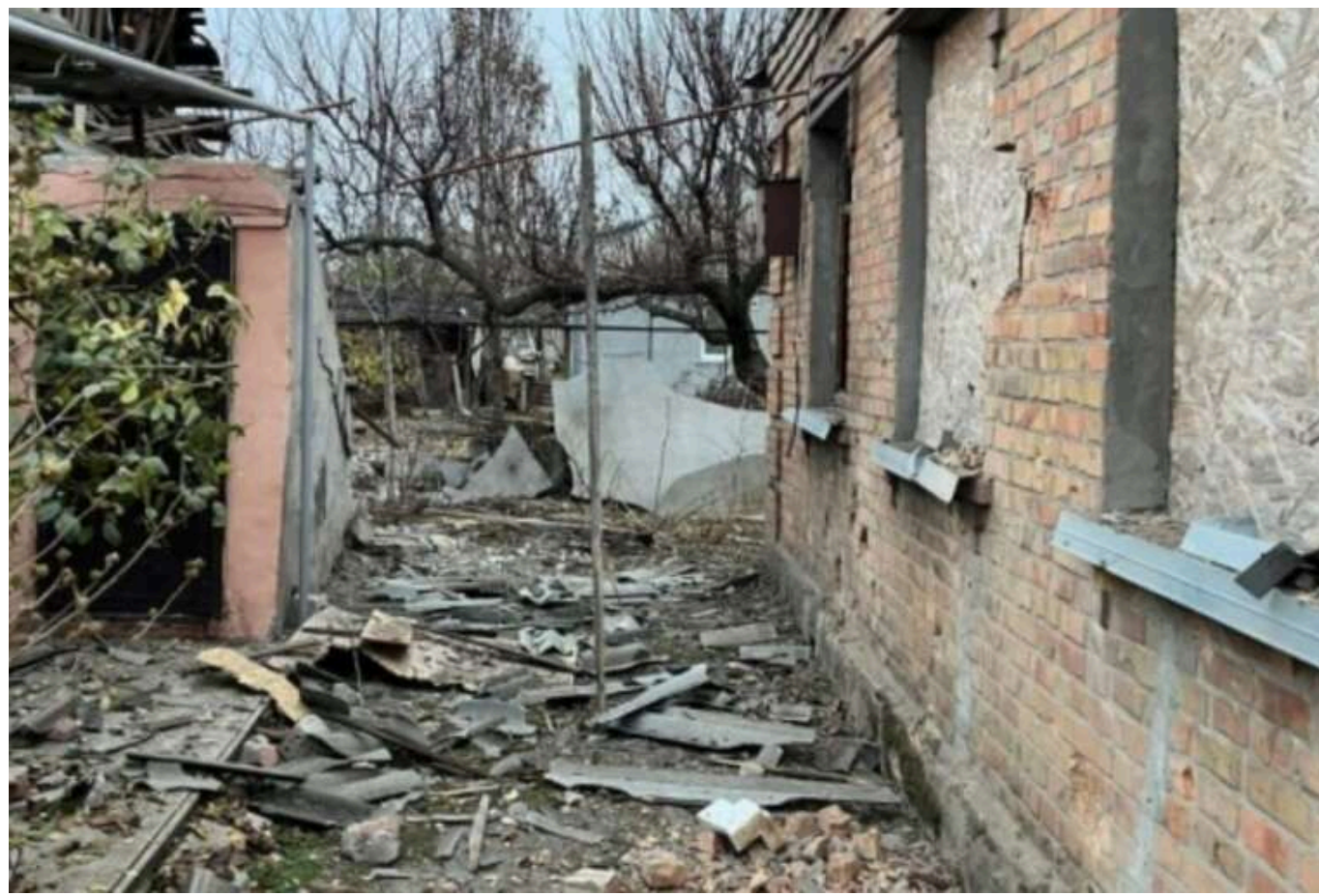
Окупанти за день здійснили атаки на Нікопольський район та Кривий Ріг: є поранений

Упродовж дня російська армія атакувала Нікопольщину, а ввечері було гучно в Кривому Розі. Внаслідок атаки одна людина зазнала поранення.