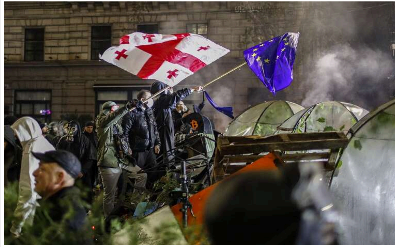
Протести в Грузії: школярі почали перекривати дороги, а вчителі оголосили страйк

Ніч протестів у Тбілісі завершилася жорстким розгоном і затриманням протестувальників. Зранку до акції приєдналися школярі.