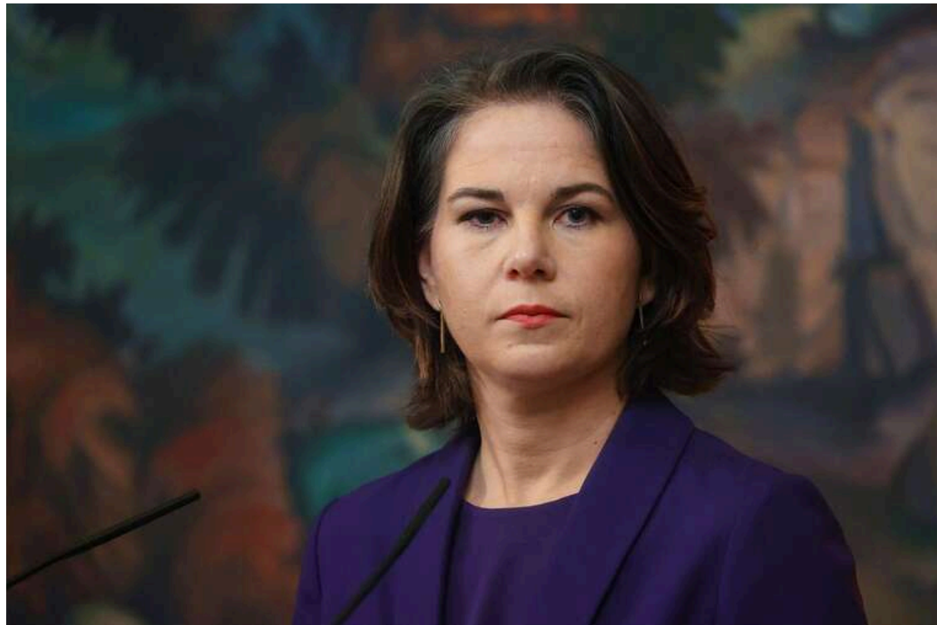
Зараз важливо підтримувати Україну та долучатися до процесу встановлення миру, - Бербок

Міністр закордонних справ Німеччини повідомила, що прибула до Китаю з метою ініціювання мирного процесу щодо України, передає Tagesschau.