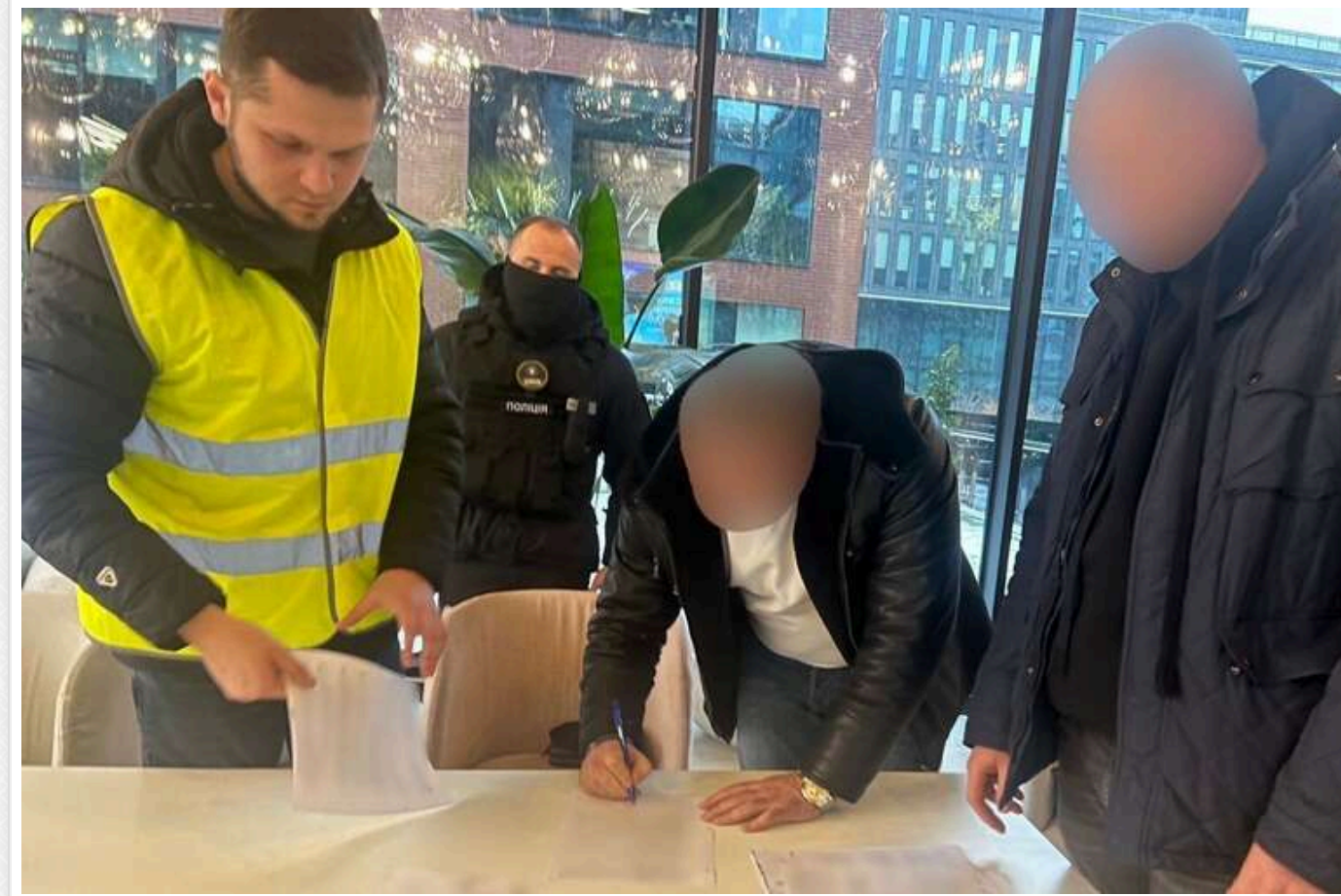
У Києві колишній працівник військкомату зі спільниками організував схему ухилення від мобілізації

Правоохоронці виявили учасників організованої групи, серед яких колишній співробітник військкомату Києва. Вони виготовляли підроблені висновки ВЛК і переправляли ухилантів через державний кордон. Вартість послуг становила від 7 до 15 тисяч доларів США.