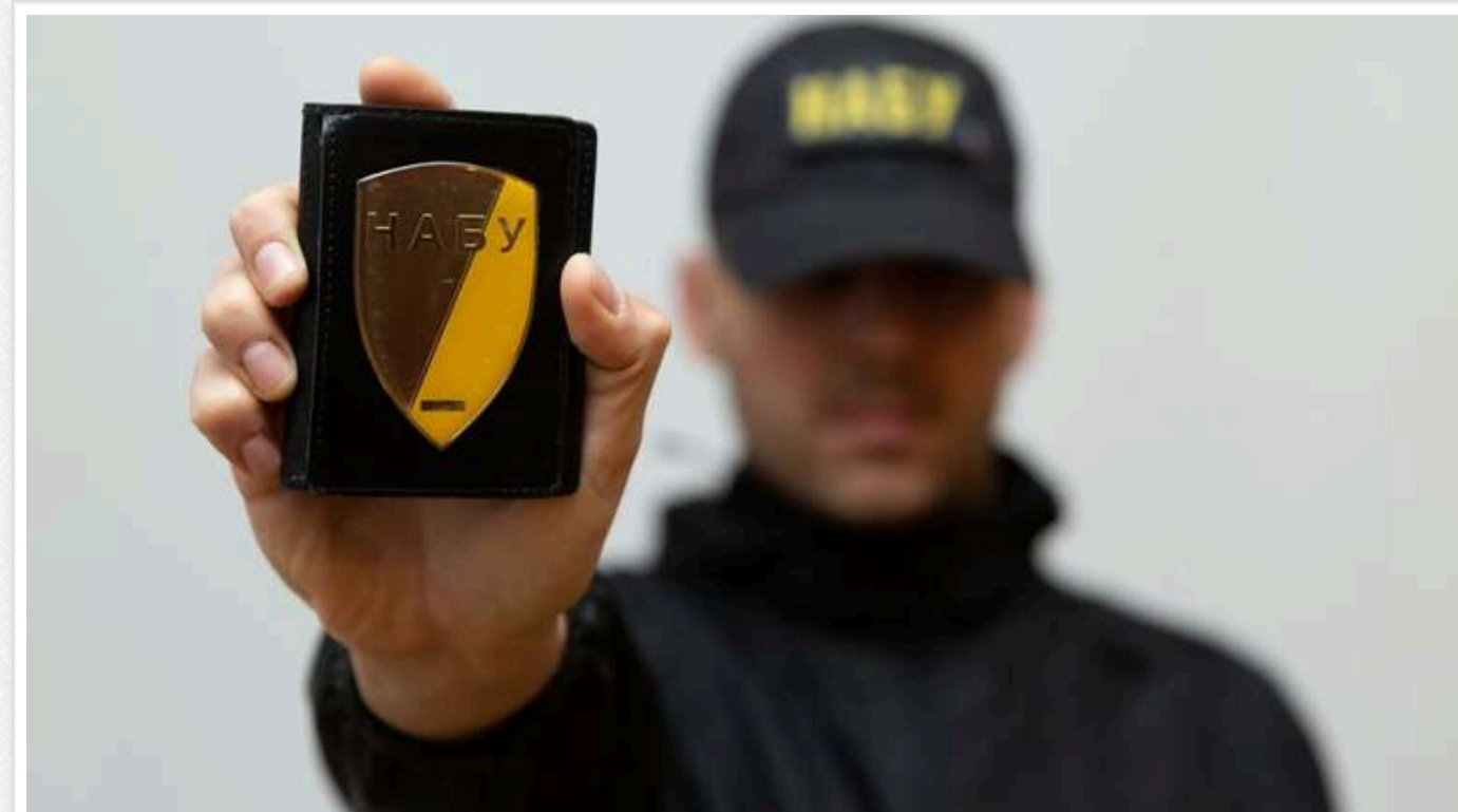
Слідство стосовно экс-нардепа та членів злочинної групи завершено: підозрюють у заволодінні державними землями у Сумській області

НАБУ та САП завершили розслідування у справі злочинної групи, очолюваної колишнім народним депутатом України – головою комітету аграрної політики у ВРУ. Її учасників підозрюють у заволодінні державними землями у Сумській області загальною площею приблизно 2,5 тис. га та у спробі заволодіння ще близько 3,3 тис. га.