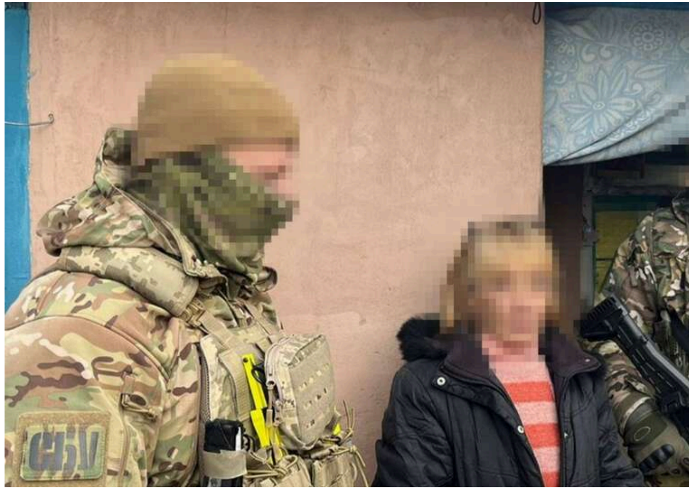
У Донецькій області викрили пенсіонерку, яка передавала окупантам дані про позиції ЗСУ

Контррозвідка СБУ виявила та затримала 67-річну пенсіонерку, яка працювала на російську військову розвідку (ГРУ). За даними слідства, жінка збирала інформацію про оборонні позиції ЗСУ та передавала їх ворогу.