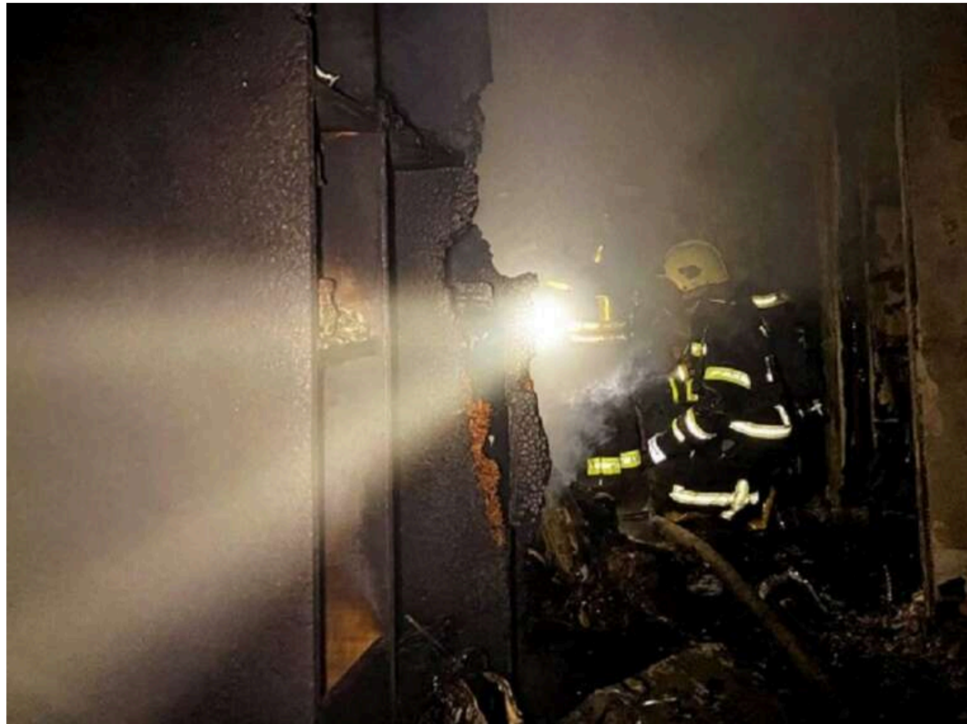
Нічна атака "шахедів": загинув 45-річний житель Тернополя, його дружина отримала важкі поранення

У ніч проти 2 грудня російські війська атакували Тернопіль, скерувавши безпілотною "Герань" на житловий будинок. Внаслідок удару загинув 45-річний чоловік, його дружина зазнала серйозних поранень.