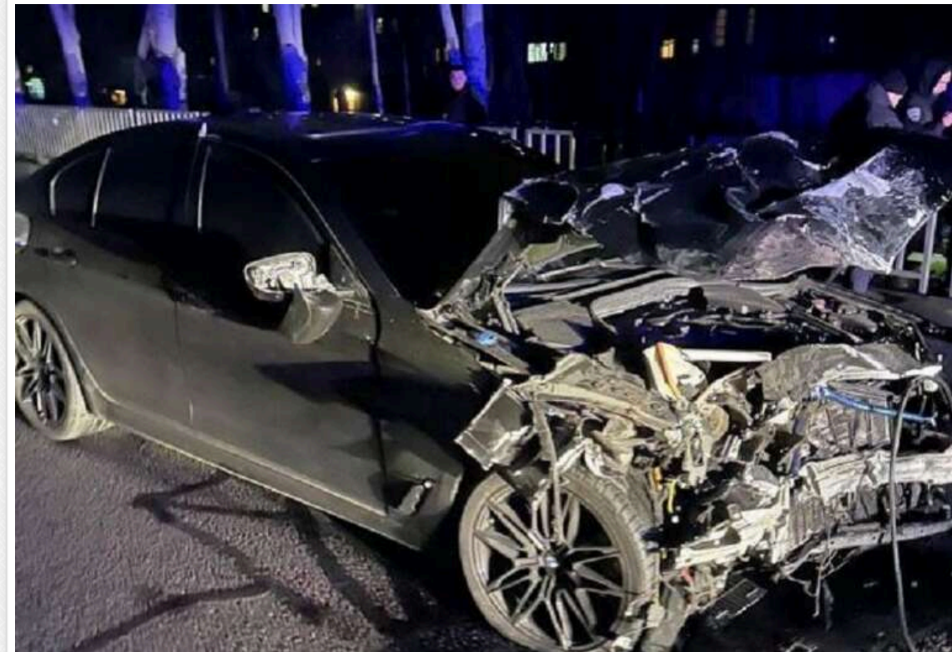
Смертельна ДТП у Дніпрі: раніше неповнолітнього водія BMW ловили без прав

У Дніпрі сталася зіткнення двох машин, внаслідок якої загинула дитина. За попередніми даними, за кермом автомобіля, що врізався в інший, був "порушник зі стажем", син місцевого бізнесмена.