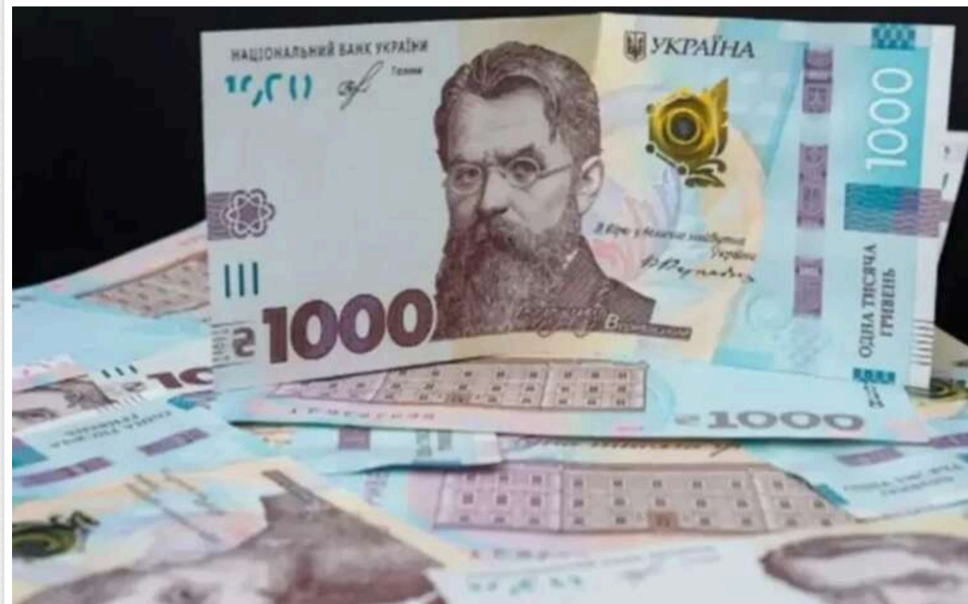
Стартував проєкт "Зимова єПідтримка": вже подано 2 500 000 заяв

Всього за одну добу українці подали рекордні 2 500 000 заяв на "Зимову єПідтримку". Ця послуга є наймасовішою у світі, а отримати виплату можна на картку "Національного кешбеку", яка підв'язана до "Дії".