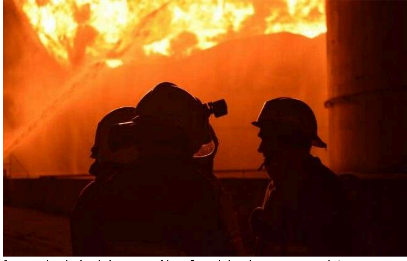
Окупанти завдали удару "шахедом" по житловому будинку в Тернополі: одна людина загинула, є постраждалі

Російські окупаційні війська в ніч на понеділок, 2 грудня, здійснили атаку ударними безпілотниками на Тернопіль і влучили в житловий будинок. Внаслідок ворожої атаки є постраждалі. Одна людина загинула.