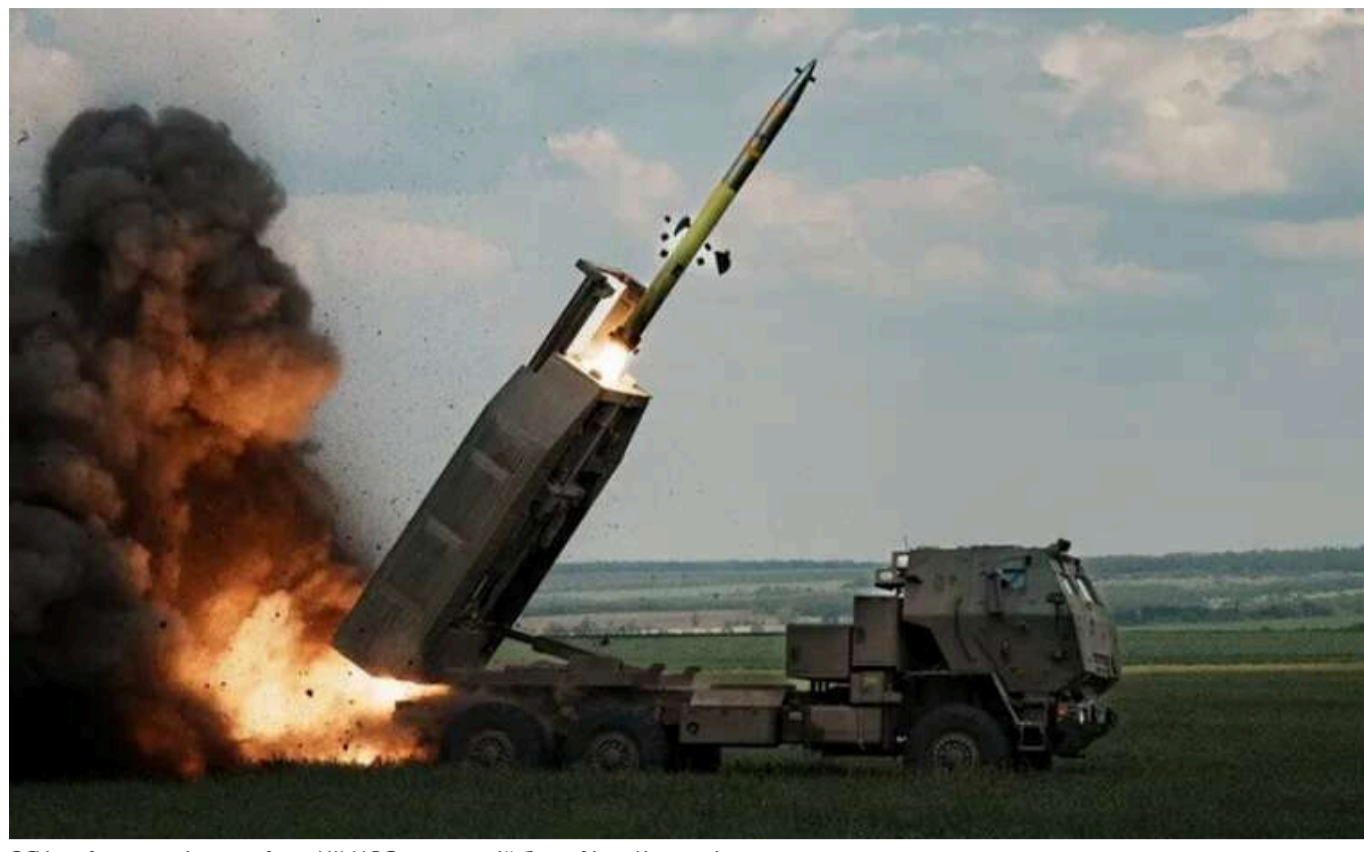
ЗСУ завдали нищівного удару HIMARS по ворожій бригаді на Курщині

30 листопада українські війська завдали удару по командному пункту російських військових на території Курської області РФ під час шиккування окупантів. Загальні втрати ворога (загиблими й пораненими) склали щонайменше 37 військовослужбовців.