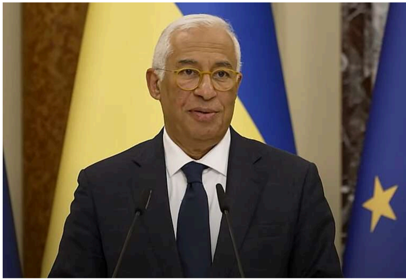
У Європейській Раді "вражені" реформами та пообіцяли відкрити переговornі кластери щодо вступу України

У Європейському Союзі вражені тим, що Україна, перебуваючи у стані війни, готується до вступу в ЄС і змогла провести важливі реформи. У першому півріччі 2025 року Євросоюз відкриє два нові переговornі кластери з нашою державою.