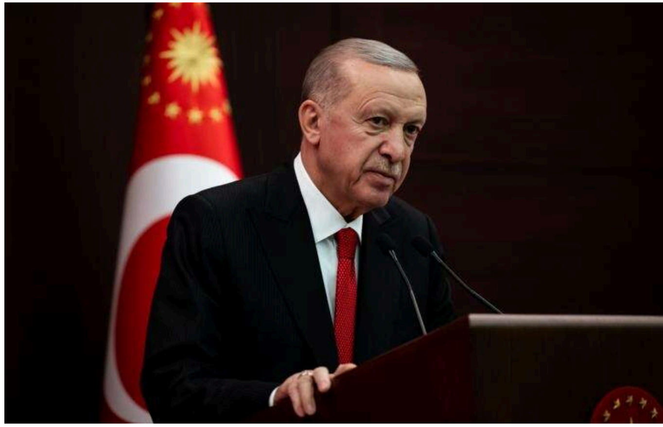
В РФ запанікували через Ердогана й заяви про шантаж

У Росії виникла істерика через те, що турецький президент Реджеп Тайп Ердоган підтримує повстанські сили в Сирії. Росіяни висловлюють занепокоєння, що після Сирії окупований Крим може стати об'єктом нападів з боку Туреччини.