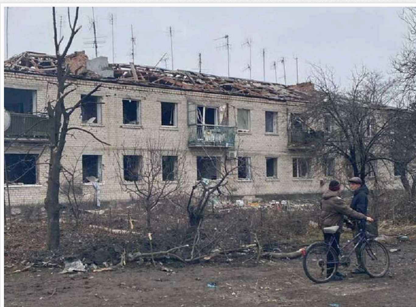
На Дніпропетровщині зросла кількість поранених внаслідок ракетного удару: з'явилися фото наслідків

У Дніпровському районі внаслідок вчорашньої російської атаки кількість поранених зросла до 24. При цьому загинули четверо осіб.